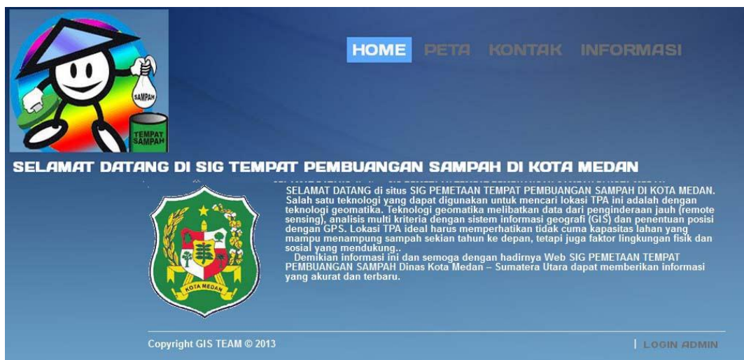
Gambar IV.1. Tampilan Menu Home pada saat Mengakses Sistem Informasi

Halaman ini merupakan tampilan awal pada saat pengguna mengakses aplikasi sistem ini, dapat dilihat pada gambar IV.1 berikut :