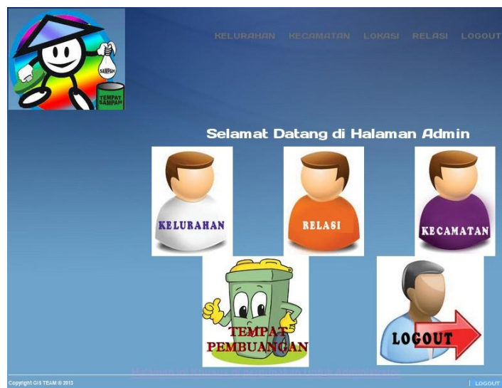
Gambar IV.7. Tampilan Halaman Utama Admin

Halaman yang dapat dipilih oleh admin mengenai data lokasi, data kecamatan, data kelurahan, dan data relasi, dilihat pada gambar IV.7 berikut :