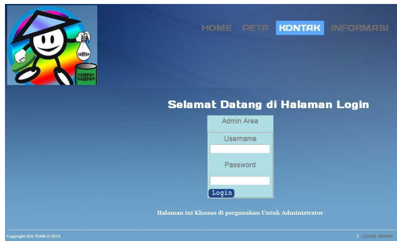
Gambar IV.6. Tampilan Halaman Masuk Admin

Untuk masuk sebagai administrator, maka admin harus melakukan login dahulu yaitu dapat dilihat pada gambar IV.6 berikut :