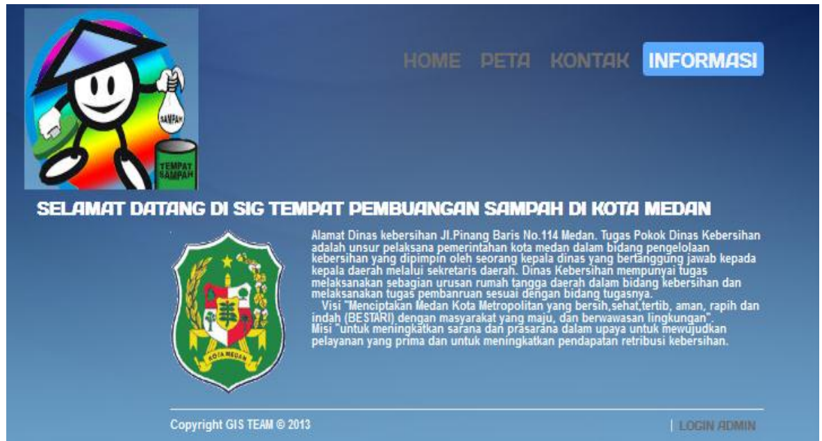
Gambar IV.5. Tampilan Halaman Lihat informasi

Pada halaman ini user dapat melihat informasi Pembuangan Sampah yang ada di Kota Medan, dapat dilihat pada gambar IV.5 berikut :