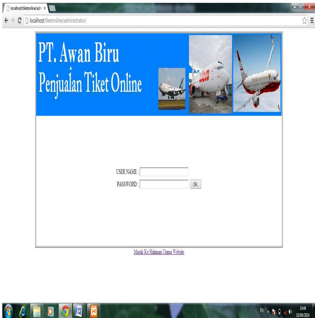
Gambar IV.6. Form Login

Form login merupakan halaman untuk dapat masuk ke sistem laporan dan mengoperasikannya.