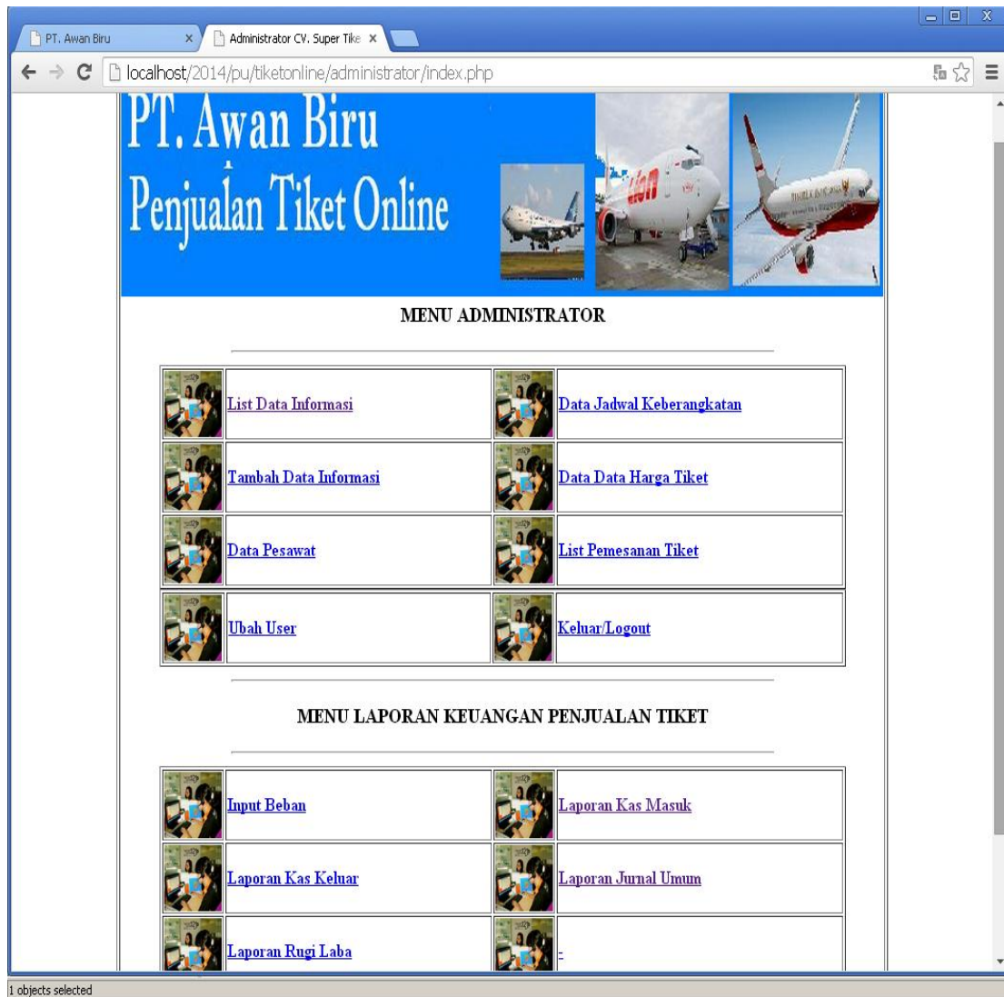
Gambar IV.7. Halaman Informasi Data menu utama

Tampilan Halaman menu utama dapat dilihat pada gambar berikut ini.