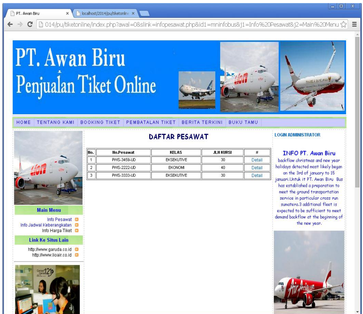
Gambar IV.5. Halaman Informasi Data PESAWAT

Tampilan Halaman Informasi PESAWAT berisi tentang data PESAWAT yang tersedia pada PJTKI. Bentuk tampilan Halaman Informasi PESAWAT dapat dilihat pada gambar berikut ini.