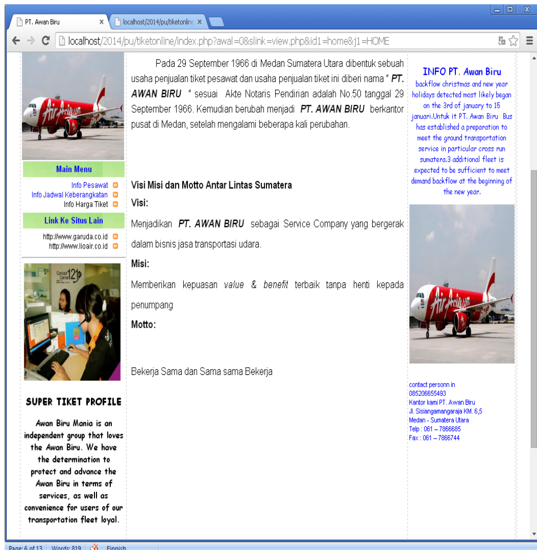
Gambar IV.2. Halaman Tentang Kami

Tampilan Halaman Tentang kami merupakan tampilan untuk menjelaskan sejarah perusahaan, visi dan misi, arti logo dan sumber daya manusia yang ada pada PT. PESAWAT. Bentuk perancangan tentang kami dapat dilihat pada gambar berikut ini.