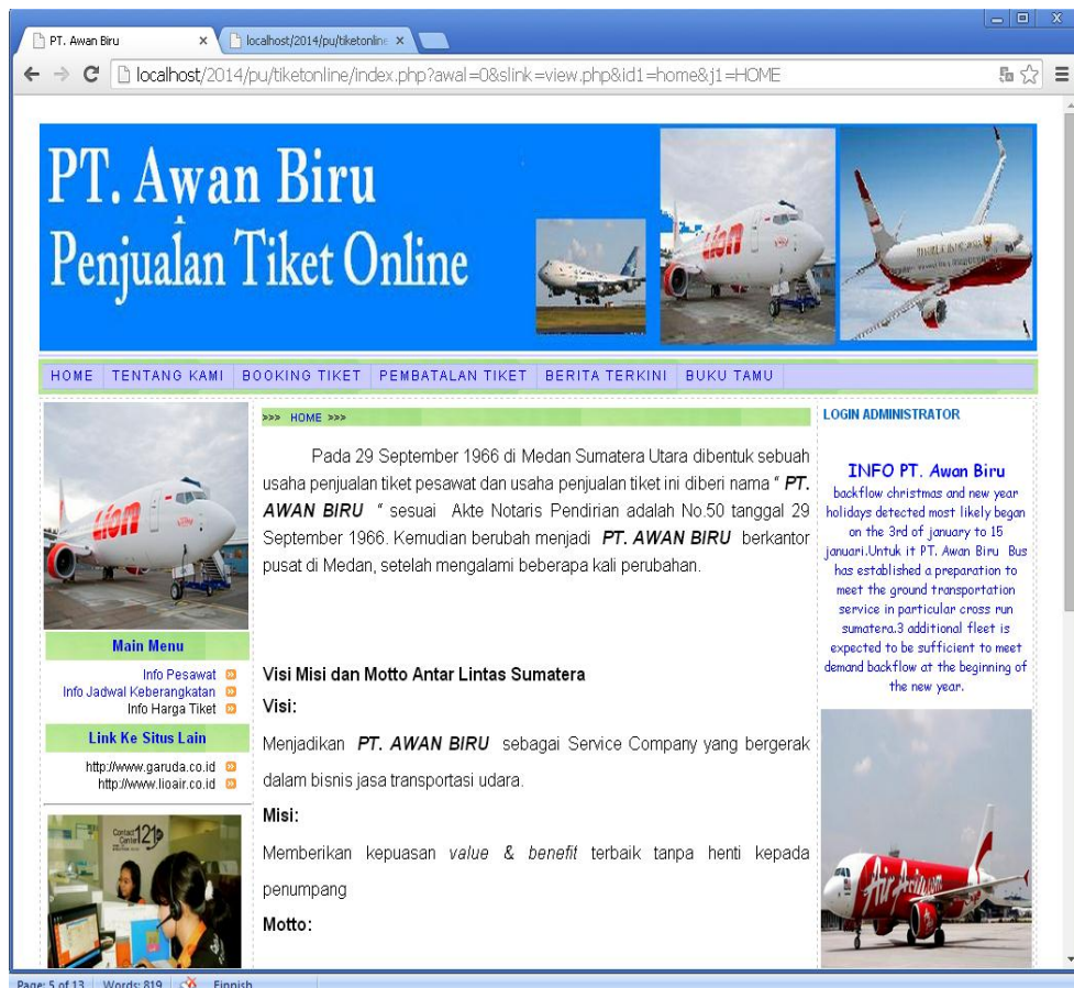
Gambar IV.1. Halaman Home

Halaman home merupakan tampilan awal pada saat aplikasi dijalankan. Dalam halaman home terdapat beberapa menu yang dapat diakses oleh pengunjung. Bentuk dari halaman home dapat dilihat seperti gambar dibawah ini :