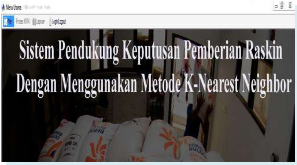
Gambar IV.1 Menu Utama