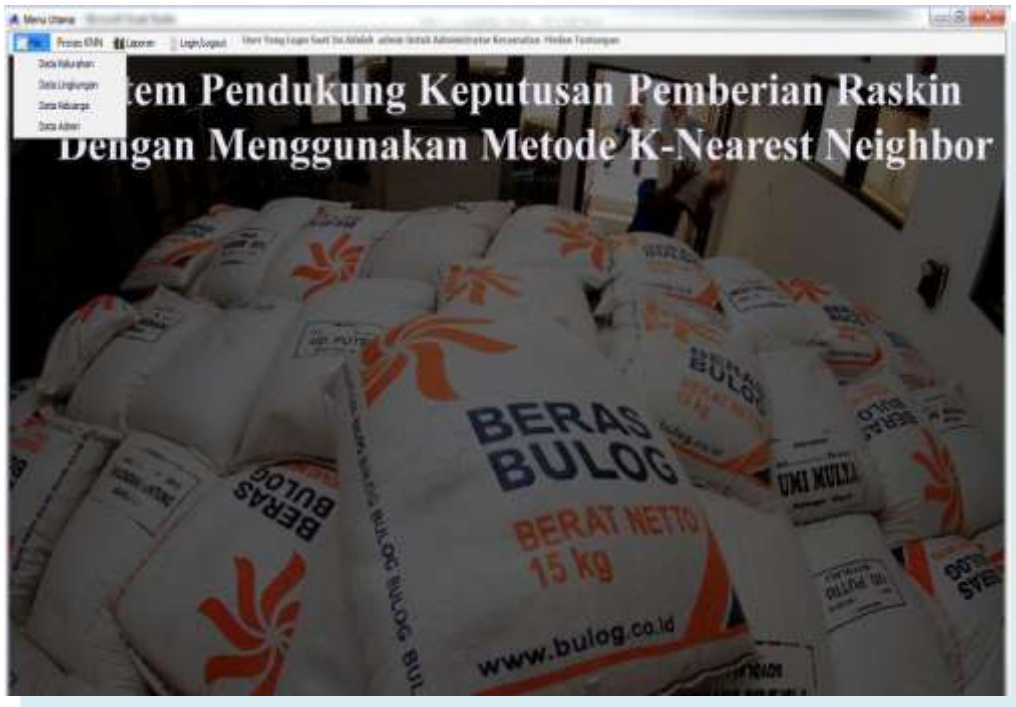
Gambar IV.3 Menu Admin

Tampilan admin ini merupakan tampilan dimana admin dapat menginput, menghapus, merubah atau mengupdate data-data kelurahan, lingkungan dan keluarga. Seperti terlihat pada gambar IV.3 berikut :