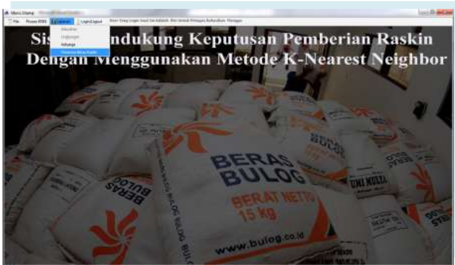
Gambar IV.13 Form input Laporan Penerima Raskin

Berikut adalah gambar laporan penerima Raskin .Dapat dilihat pada gambar IV.12