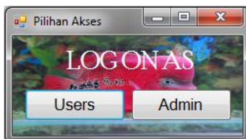
Gambar IV.1. Form Pemilihan Menu

Form pemilihan menu merupakan form yang digunakan untuk memilih akses sistem. Tampilan form pemilihan menu yang penulis rancang dapat dilihat pada gambar IV. 1 berikut ini :