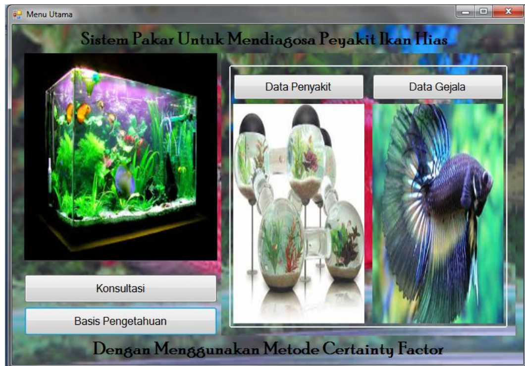
Gambar IV.8. Form Basis Pengetahuan