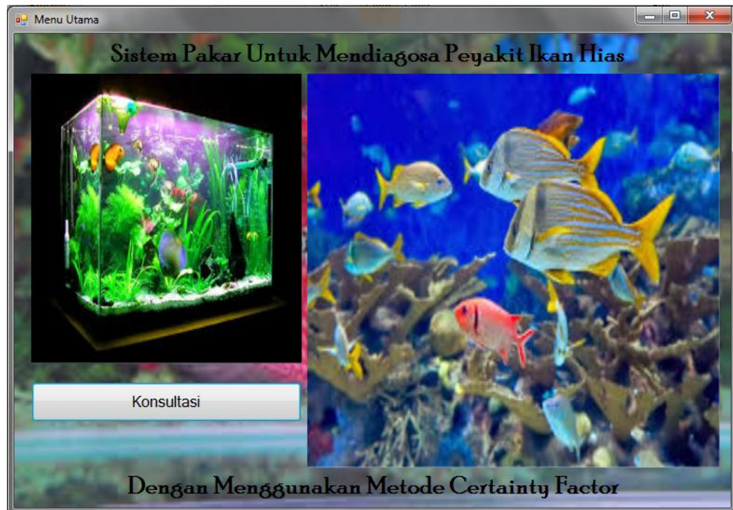
Gambar IV.2. Form Pemilihan Menu