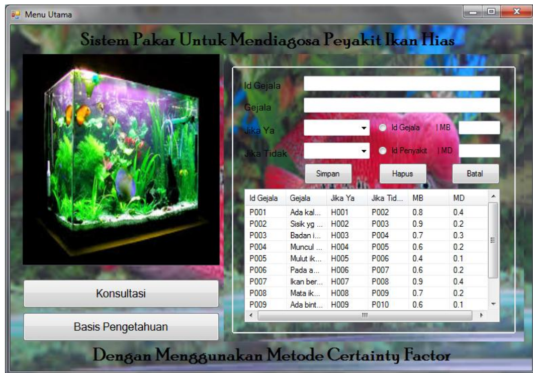
Gambar IV.10. Form Data Gejala