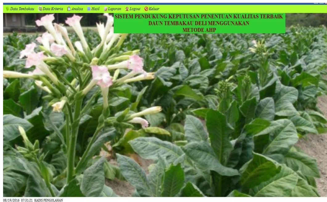
Gambar IV.2. Form Utama

Setelah Kadis Pengolahan berhasil login dengan menginputkan username dan password dengan benar, maka akan langsung muncul beranda atau sebagai form utama. Pada form ini terdapat banyak menu yang dapat digunakan Kadis Pengolahan dengan banyak fungsi sesuai kebutuhan. Gambar dari tampilan form utama dapat dilihat pada gambar IV.2.