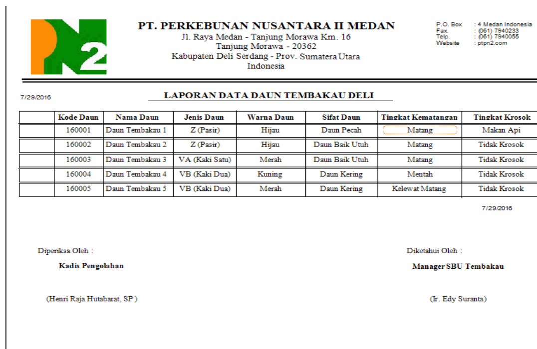
Gambar IV.9. Laporan Data Daun Tembakau

Tampilan ini merupakan tampilan laporan data daun tembakau deli. Gambar tampilan laporan ditunjukkan pada gambar IV.8.