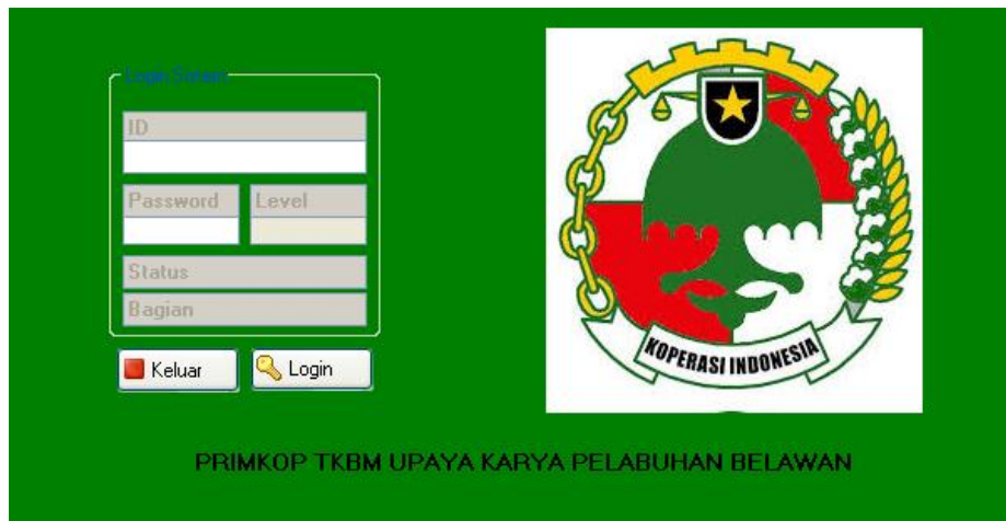
Gambar IV.1. Tampilan Form Login

Tampilan Form login merupakan form untuk memasukan ID,password, level, dan status agar program dapat dibuka seperti pada Gambar IV.1.