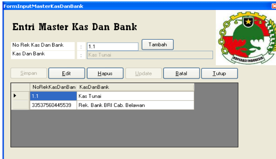
Gambar IV.4. Tampilan Form Entri Data Master Kas Dan Bank

Pada form entri data master kas dan bank berfungsi untuk menginputkan data master kas dan bank yang terlihat pada gambar IV.4.