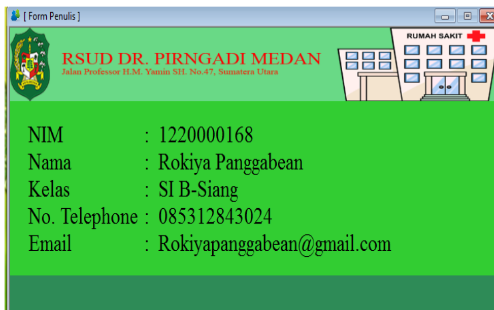
Gambar IV.10. Tampilan Form Pembuat Aplikasi

Tampilan halaman ini berisikan tampilan tentang penulis aplikasi, seperti ditunjukkan pada Gambar IV.10. berikut ini: