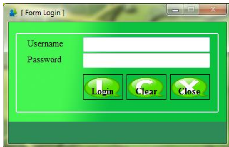
Gambar IV.1. Tampilan Form Login

Tampilan halaman ini berisikan tampilan awal dalam menjalankan aplikasi penerimaan calon perawat, yaitu berupa tampilan login aplikasi, ditunjukkan pada Gambar IV.1. berikut ini: