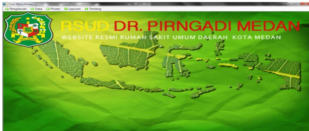
Gambar IV.2. Tampilan Form Utama

Tampilan halaman ini berisikan tampilan setelah melakukan login dalam menjalankan aplikasi penerimaan perawat, yaitu berupa tampilan form menu utama aplikasi, seperti ditunjukkan pada Gambar IV.2. berikut ini: