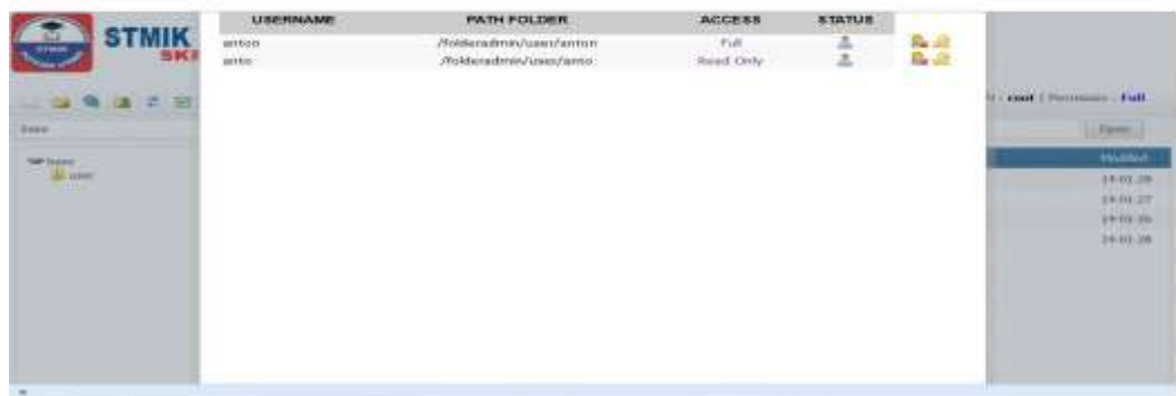
Gambar IV.7 Tampilan List user

Tampilan ini di fungsikan untuk melihat dan menghapus user yang ada. Ketika ingin menambah user , terdapat dua level . Yaitu read only ( hak akses terbatas) dan full (hak akses tidak terbatas).Tampilan dapat dilihat pada gambar IV.7.