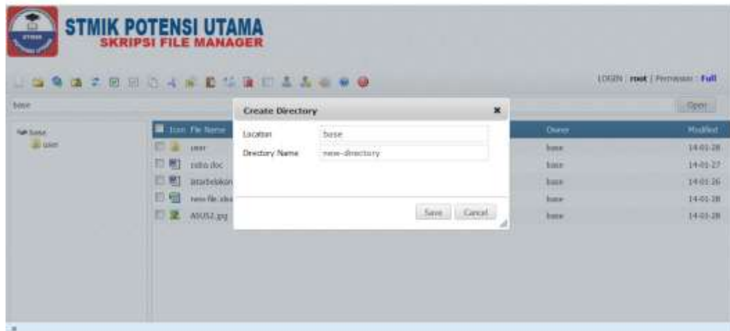
Gambar IV.5 Tampilan Create New Directory

Tampilan ini di fungsikan untuk membuat folder baru. Adapun tampilan pada menu create new directory dapat dilihat pada gambar IV.5.