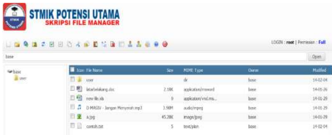
Gambar IV.3 Tampilan Menu Utama

Tampilan ini merupakan tampilan dari menu utama, dimana terdapat tujuh pilihan menu, yaitu create new file , create new directory , upload file , list user , add user , change password , about dan logout . Adapun tampilan pada menu utama dapat dilihat pada gambar IV.3.