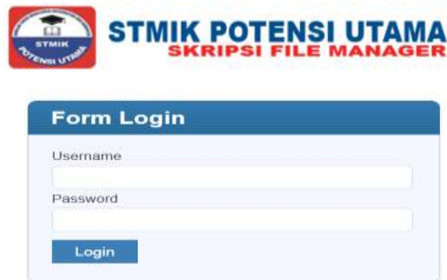
Gambar IV.1 Tampilan Login Admin

Adapun tampilan pada menu login admin dapat dilihat pada gambar IV.1