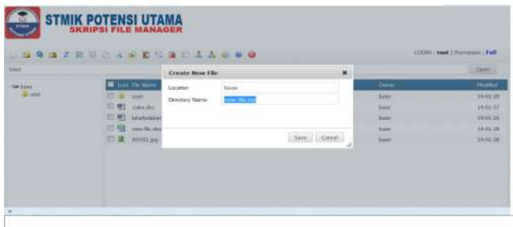
Gambar IV.4 Tampilan Create New File

Tampilan ini di fungsikan untuk membuat sebuah file baru. Adapun tampilan pada menu create new file dapat dilihat pada gambar IV.4.