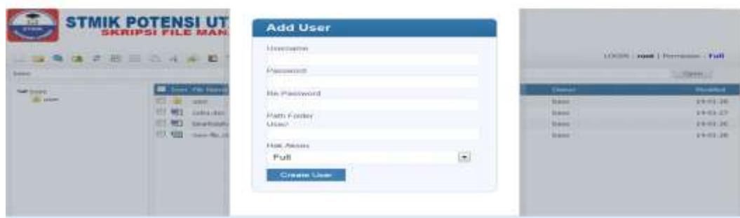
Gambar IV.8 Tampilan Add User

Tampilan ini di fungsikan untuk membuat dan menambah user. Ketika admin menambah user , admin dapat langsung menentukan hak akses user, apakah full ( hak akses tidak terbatas) atau read only ( hak akses terbatas).