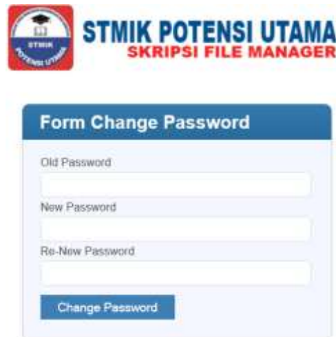
Gambar IV.9 Tampilan Change Password

Tampilan ini di fungsikan untuk mengganti password lama dengan password baru admin . Adapun tampilan pada menu change password dapat dilihat pada gambar IV.9.