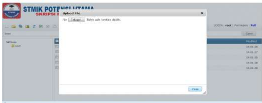
Gambar IV.6 Tampilan Upload File

Tampilan ini di fungsikan untuk mengunggah file dari dalam komputer. Tampilan dapat dilihat pada gambar IV.6.