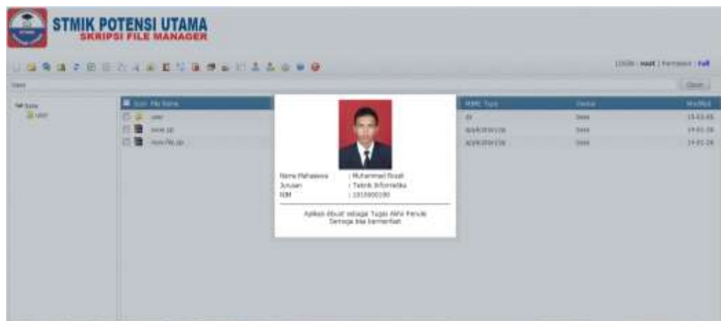
Gambar IV.10 Tampilan About

Tampilan ini adalah hasil dari tombol About yaitu tombol untuk melihat gambar dan tentang penulis. Adapun tampilan About dapat dilihat pada gambar IV.10.