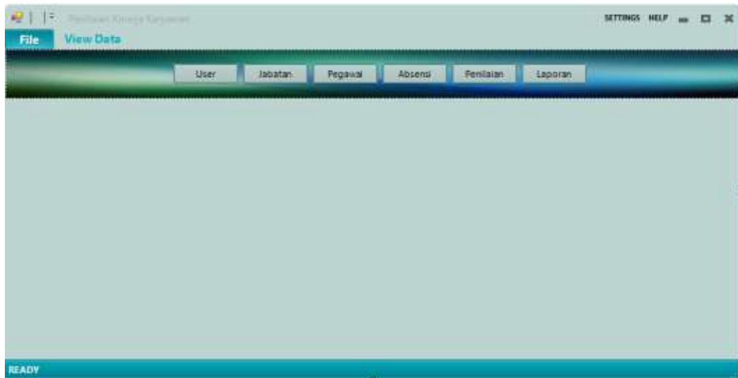
Gambar IV.2. Tampilan Form Menu Utama

Form ini berfungsi untuk menampilkan Menu file, data dan laporan seperti terlihat pada gambar IV.2. berikut :