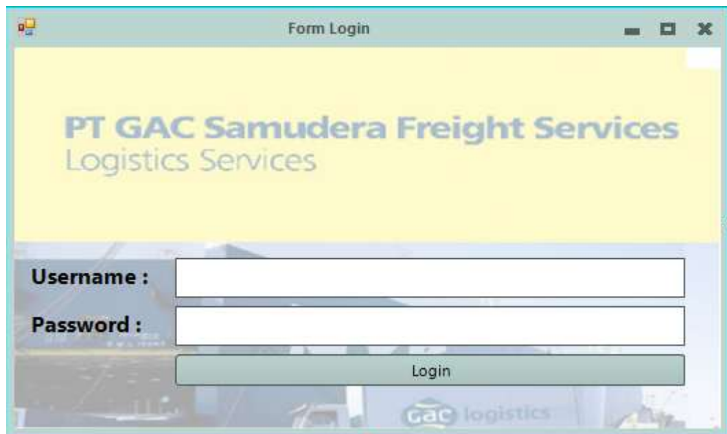
Gambar IV.1. Tampilan Form Login

Form login merupakan form untuk memasukan password agar program dapat dibuka seperti pada gambar IV.1. berikut :