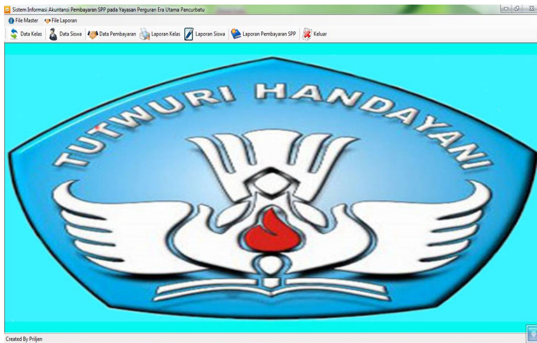
Gambar IV.2 Menu Utama