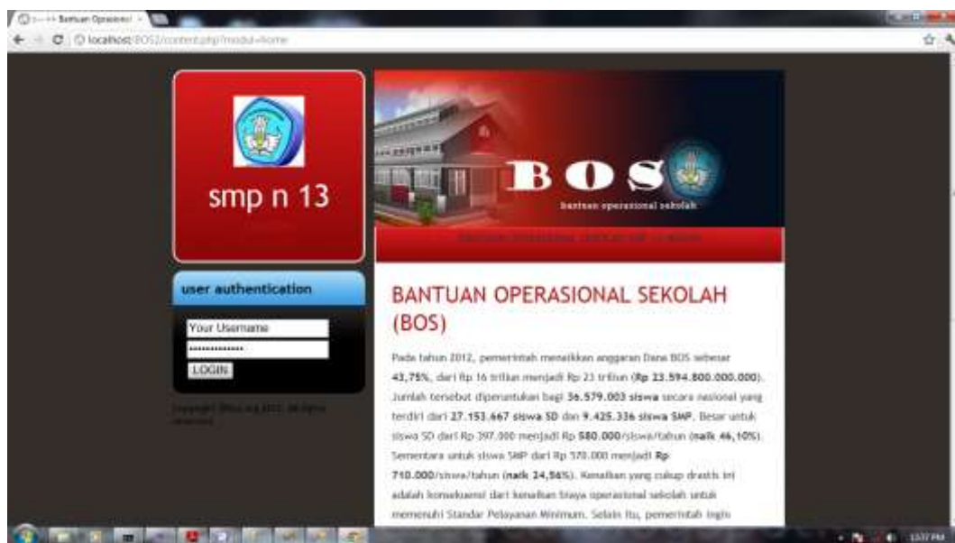
Gambar IV.1 Menu Utama

Tampilan ini merupakan tampilan awal pada saat aplikasi dijalankan dan merupakan suatu tampilan untuk menampilkan menu-menu lainnya yang ada didalam aplikasi ini. Seperti terlihat pada gambar IV.1 berikut :