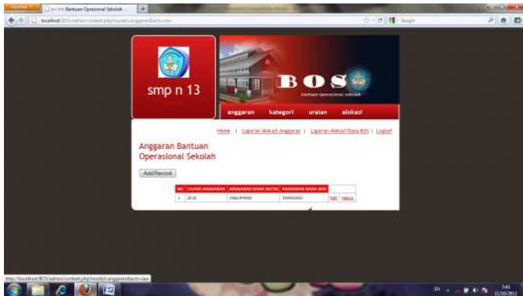
Gambar IV.4 Tampilan Halaman Anggaran