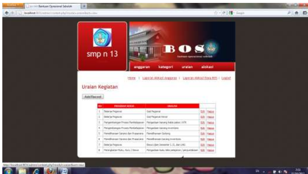
Gambar IV.9 Halaman Input Uraian Kategori

Halaman ini bertujuan untuk menampilkan data alokasi dari dana BOS yang ada. Seperti terlihat pada gambar IV.9 berikut :