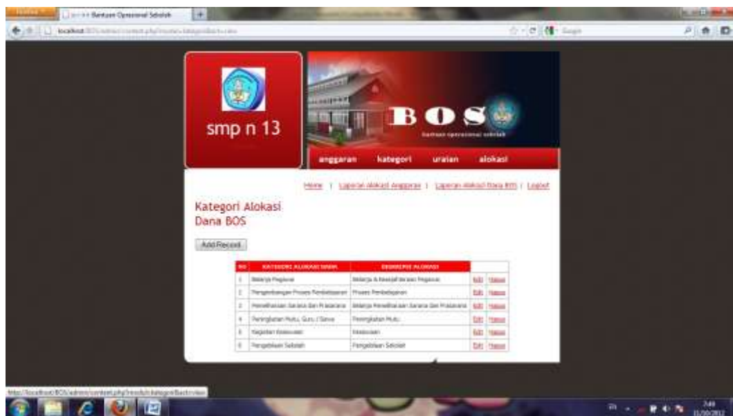
Gambar IV.6 Halaman Kategori Alokasi

Halaman ini bertujuan untuk menampilkan data kategori alokasi dari dana BOS yang ada. Seperti terlihat pada gambar IV.6 berikut :