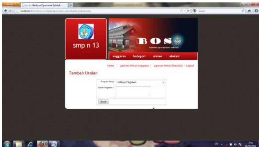
Gambar IV.10 Halaman Tambah Data Uraian

Halaman ini bertujuan untuk menambah data alokasi uraian kategori yang baru. Seperti terlihat pada gambar IV.10 berikut :