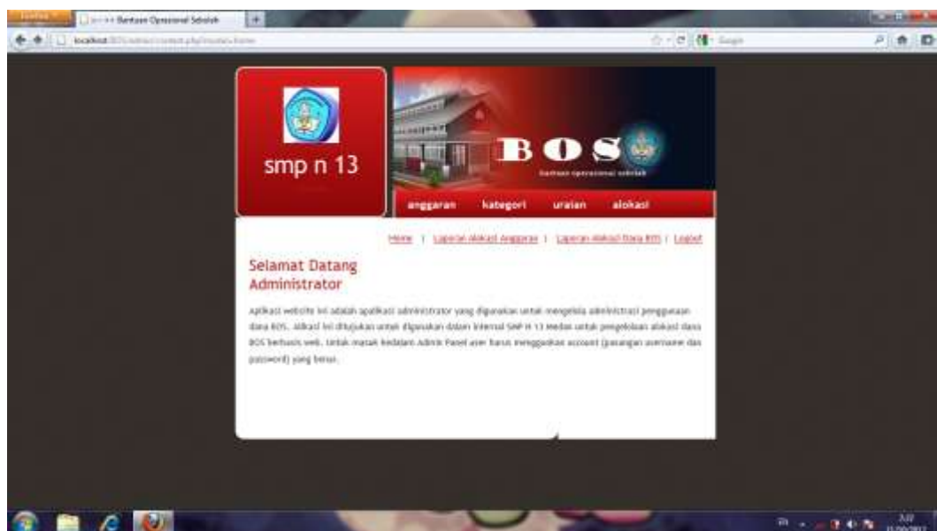
Gambar IV.3 Halaman Administrator

Tampilan menu administrator ini adalah merupakan halaman bagi admin untuk melakukan edit pada sistem. Seperti terlihat pada gambar IV.3 berikut :