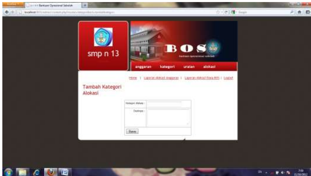
Gambar IV.8 Halaman Input Data Kategori Alokasi