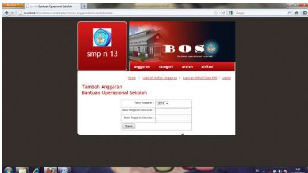
Gambar IV.5 Form Input Data Anggaran

Form input data anggaran ini bertujuan untuk menginputkan data anggaran. Seperti terlihat pada gambar IV.5 berikut :