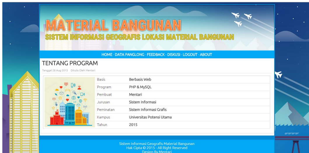
Gambar IV.6. Tampilan Sistem Form About

Tampilan yang disajikan oleh sistem saat terjadi event pada form about gambar dapat dilihat pada gambar IV.6 :