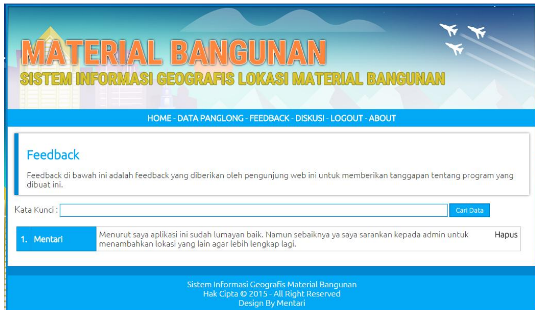
Gambar IV.5. Tampilan Sistem Form Daftar Feedback