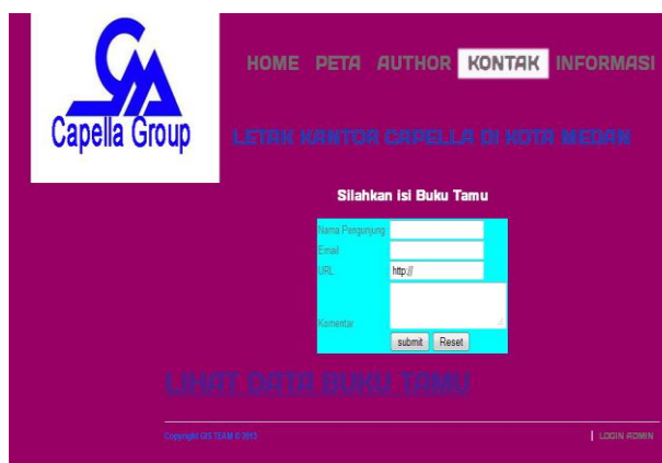
Gambar IV.4. Tampilan Halaman Pengisian Buku Tamu Pada kantor Capella di Kota Medan

Pada halaman ini user dapat memberikan kritik dan saran melalui menu kontak pada buku tamu yang terdapat pada Sistem Informasi Geografis pemetaan kantor Capella di kota medan, dapat dilihat pada gambar IV.4 dan IV.5 berikut :