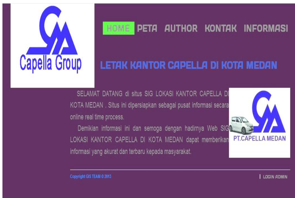
Gambar IV.1. Tampilan Menu Home pada saat Mengakses Sistem Informasi

Halaman ini merupakan tampilan awal pada saat pengguna mengakses aplikasi sistem ini, dapat dilihat pada gambar IV.1 berikut :