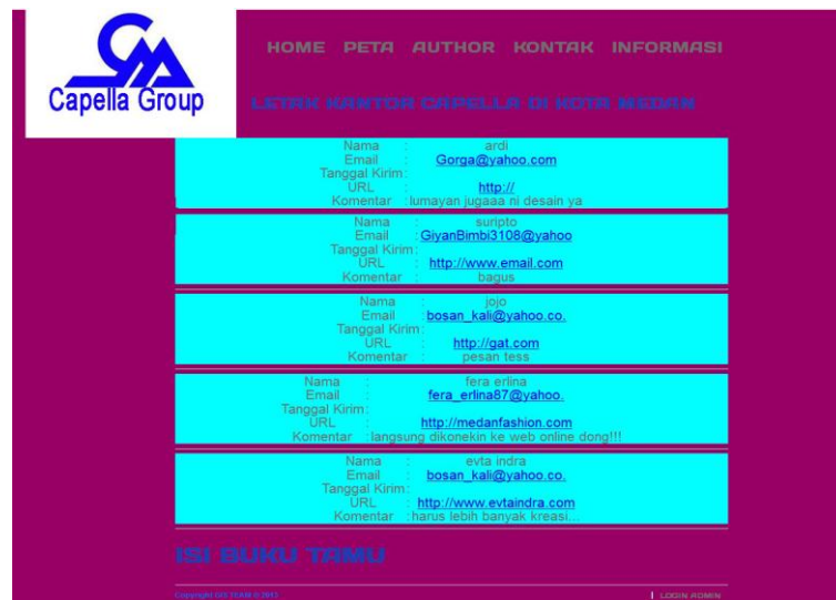
Gambar IV.5. Tampilan Halaman Lihat Buku Tamu pada Kantor Capella di Kota Medan