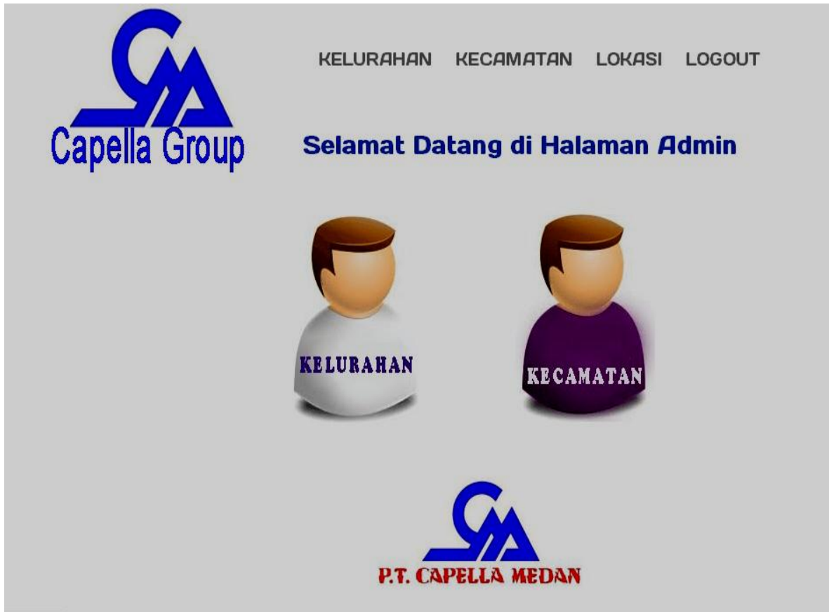
Gambar IV.7. Tampilan Halaman Utama Admin

Halaman utama data yang dapat dipilih oleh admin mengenai data Capella, data kecamatan, data kelurahan di Kota Medan, data tersebut dapat disimpan, diedit dan dihapus, dapat dilihat pada gambar IV.7 berikut :