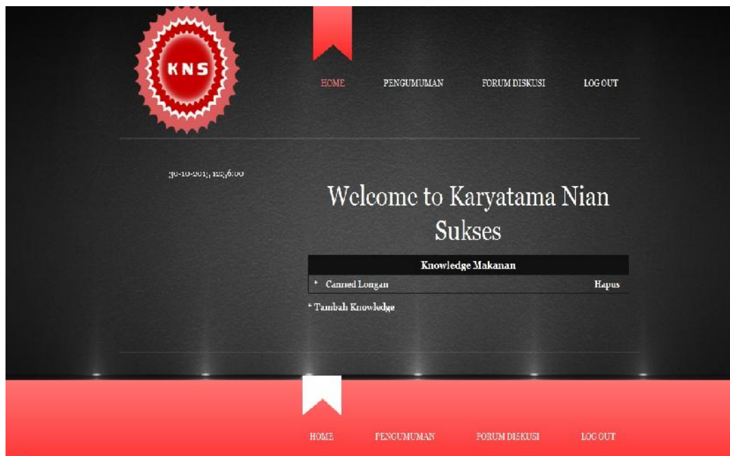
Gambar IV.2 Tampilan Form Home Admin