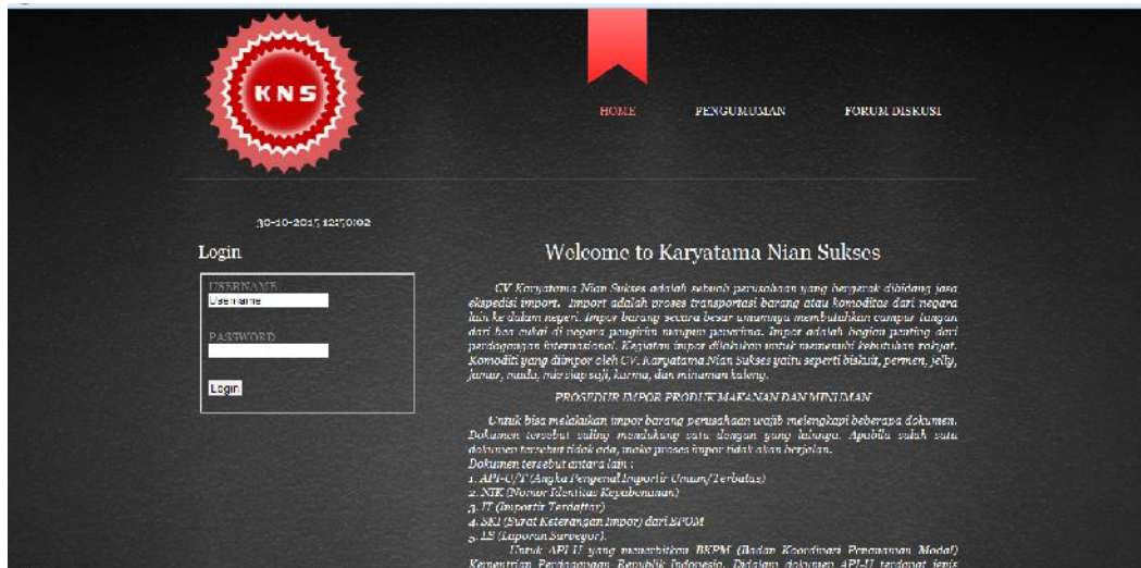
Gambar IV.1 Tampilan Beranda /Login

Berikut adalah tampilan Beranda /Login pada sistem yang dibuat :