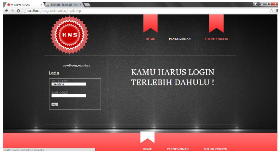
Gambar IV.4 Tampilan Form Pengumuman Beranda

Form pengumuman beranda merupakan tampilan awal yang hanya dapat diakses jika pengguna login terlebih dahulu. Berikut adalah tampilan form pengumuman beranda :