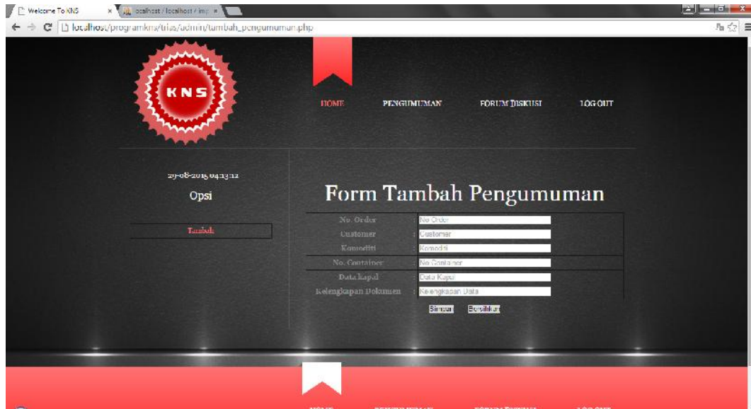
Gambar IV.7 Tampilan Form Tambah Pengumuman

Form ini berfungsi untuk menambah data-data dokumen pada system yang hanya dapat dilakukan oleh admin. Berikut adalah tampilan form tambah pengumuman: