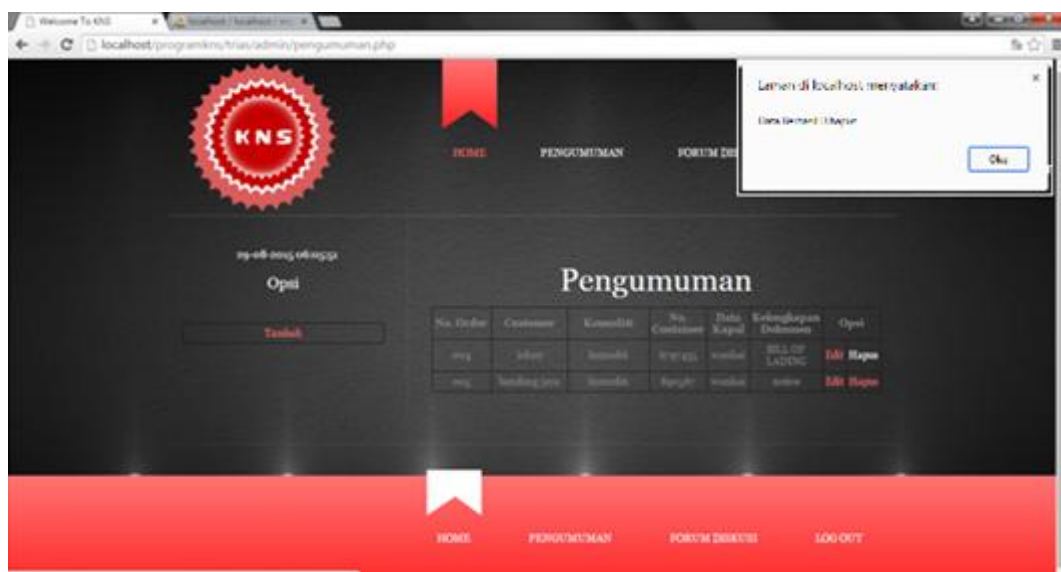
Gambar IV.9 Tampilan Form Hapus Pengumuman

Form ini berfungsi untuk menghapus data-data dokumen pada system jika ada kesalahan yang telah di input oleh admin dan hanya dapat dilakukan oleh admin. Berikut adalah tampilan form hapus pengumuman: