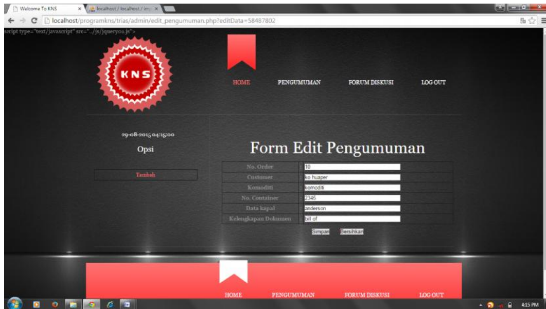
Gambar IV.8 Tampilan Form Edit Pengumuman