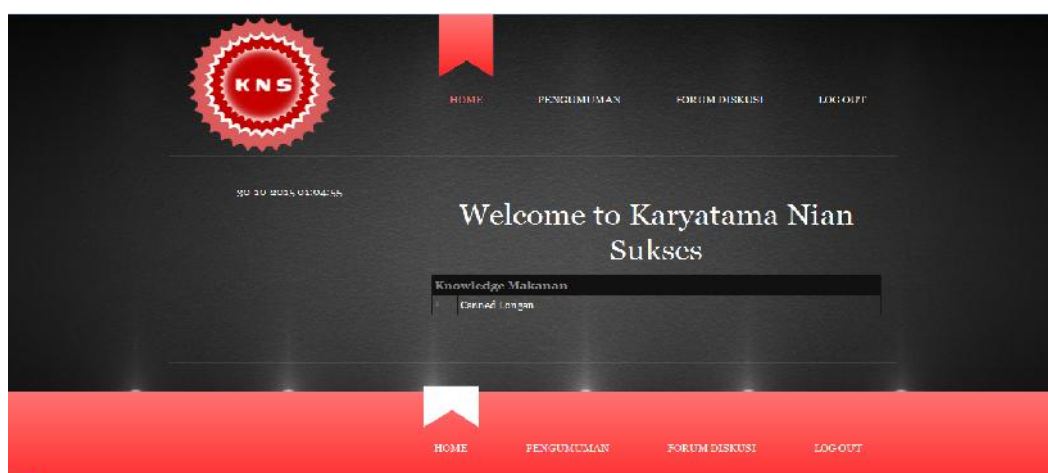
Gambar IV.3 Tampilan Form Home User

Form home User merupakan form yang berisikan tentang pengetahuan tentang makanan dan minuman. Form ini hanya bisa dilihat tanpa bisa mengubahnya. Berikut merupakan tampilan form user pada sistem yang dibuat :