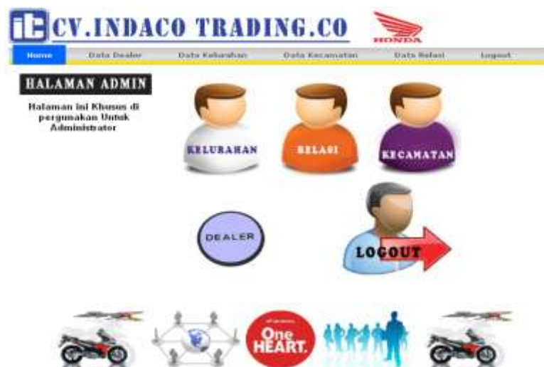
Gambar IV.6. Tampilan Halaman Utama Admin

Halaman utama data yang dapat dipilih oleh admin mengenai data dealer, data kecamatan, data kelurahan, data yang berada di Kota Medan, data tersebut dapat disimpan, diedit dan dihapus, yaitu dapat dilihat pada gambar VI.6. berikut