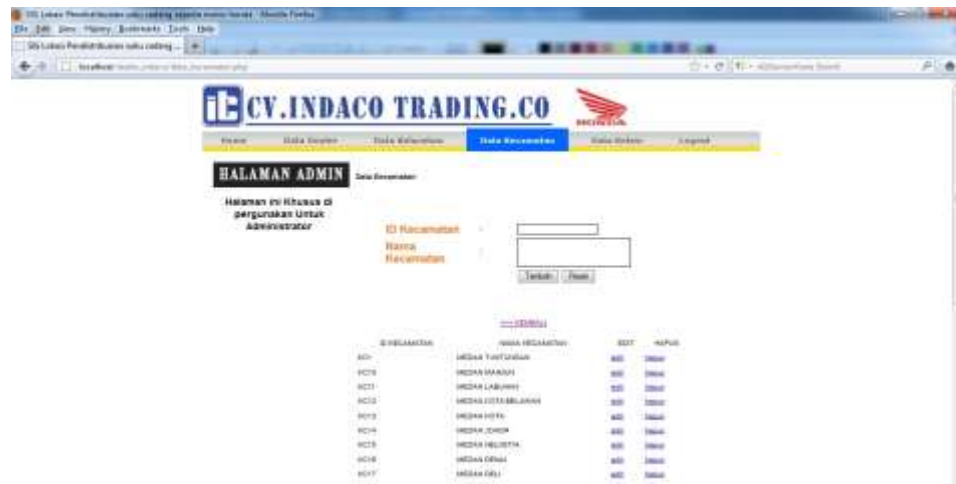
Gambar IV.9. Tampilan Halaman Input Data Kecamatan

Data Kecamatan adalah data yang di input oleh admin mengenai kecamatan yang berada di Kota Medan, dapat dilihat pada gambar VI.9. berikut ini.