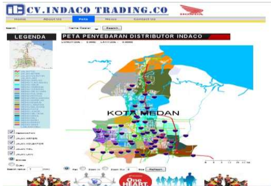
Gambar IV.3. Tampilan Halaman Peta Dealer Honda di Kota Medan