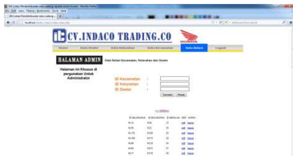
Gambar IV.10. Tampilan Halaman Input Data Relasi

Data Relasi adalah data yang di input oleh admin mengenai data Relasi antara Dealer, Kecamatan, Kelurahan yang dapat dilihat pada gambar VI.10. berikut