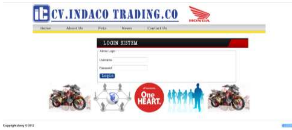
Gambar IV.5. Tampilan Halaman Masuk Admin

Untuk masuk sebagai administrator, maka admin harus melakukan login dahulu yaitu dapat dilihat pada gambar VI.5. berikut