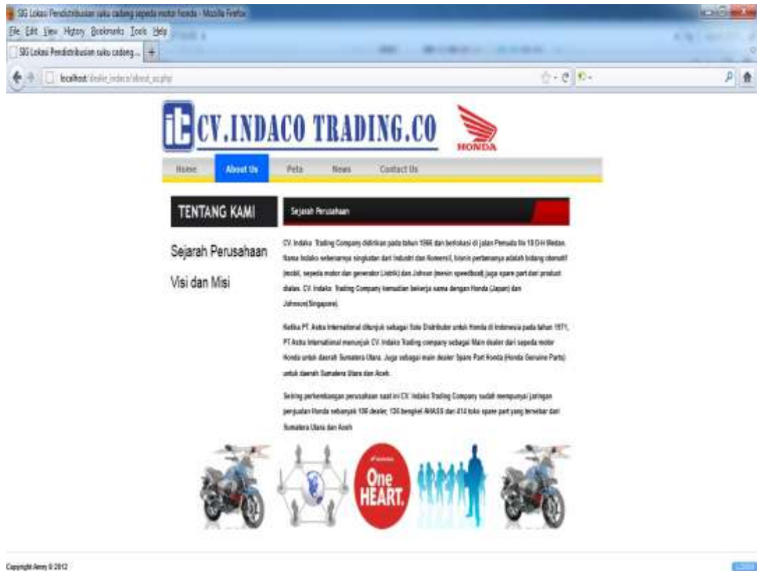
Gambar IV.2. Tampilan Halaman About Us

Pada halaman ini menampilkan tentang sejarah, visi dan misi perusahaan sistem informasi dan ucapan terimakasih kepada para pengunjung website sistem informasi ini, gambar VI.2. berikut ini menunjukkan halaman About Us