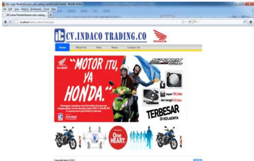
Gambar IV.1. Tampilan Halaman Menu Home

Halaman ini merupakan tampilan awal pada saat pengguna mengakses aplikasi sistem ini, gambar VI.1. berikut ini menunjukkan halaman home