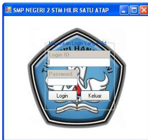
Gambar IV.1. Tampilan Form Login

Form login merupakan form untuk memasukan password agar program dapat dibuka seperti pada gambar IV.1. berikut :