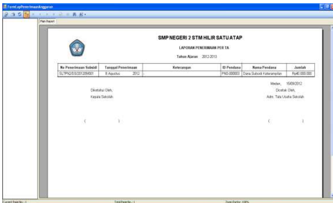
Gambar IV.12. Tampilan Laporan Penerimaan Per TA

Setelah katagori laporan diinputkan, maka akan muncul laporan penerimaan subsidi per TA berdasarkan kriteria yang diinputkan seperti gambar di IV.12 dibawah ini :