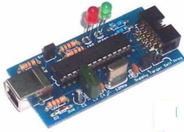
Gambar II.6. USBasp Downloader