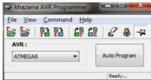
Gambar II.5. Tampilan KhazamaAVR Programmer

Adapun perangkat lunak yang penulis gunakan untuk men- download program ke dalam Mikrokontroler ATmega8535 adalah KhazamaAVR Programmer. Software yang digunakan untuk mendownload program ke IC Mikrokontroler disebut KhazamaAVR Programmer. Dengan menggunakan software ini kita bisa mengisikan file *.hex yang telah di- Compile (diciptakan) oleh beberapa software seperti CodeVisionAVR. Tampilan KhazamaAVR Programmer ditunjukkan pada Gambar II.5. berikut.