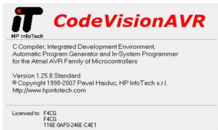
Gambar II.4. Tampilan CodeVisionAVR

Adapun tampilan CodeVisionAVR adalah sebagai berikut :