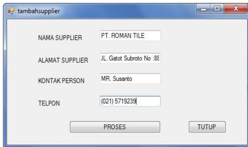
Gambar IV.3 : Tampilan Form tambah Supplier

Halaman ini digunakan bagian finance untuk menambah data supplier, dapat dilihat pada gambar IV.2 berikut :