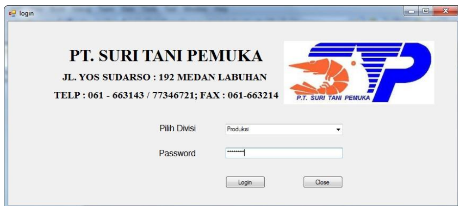
Gambar IV.1 : Tampilan Halaman Login

Untuk dapat mengakses informasi mengenai transaksi keuangan maka harus memiliki hak akses sesuai dengan data pengguna. Masuk sebagai user, maka user harus melakukan login dahulu yaitu dapat dilihat pada gambar IV.1 berikut :