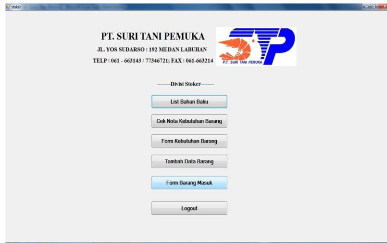
Gambar IV.2 : Tampilan Nota Kebutuhan Barang

Halaman ini merupakan tampilan awal pada saat pengguna mengakses halaman Stoker, dapat dilihat pada gambar IV.2 berikut :