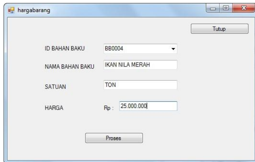
Gambar IV.3 : Tampilan Form tambah Harga Barang

Halaman ini digunakan bagian finance untuk menambah harga bahan baku, dapat dilihat pada gambar IV.2 berikut :