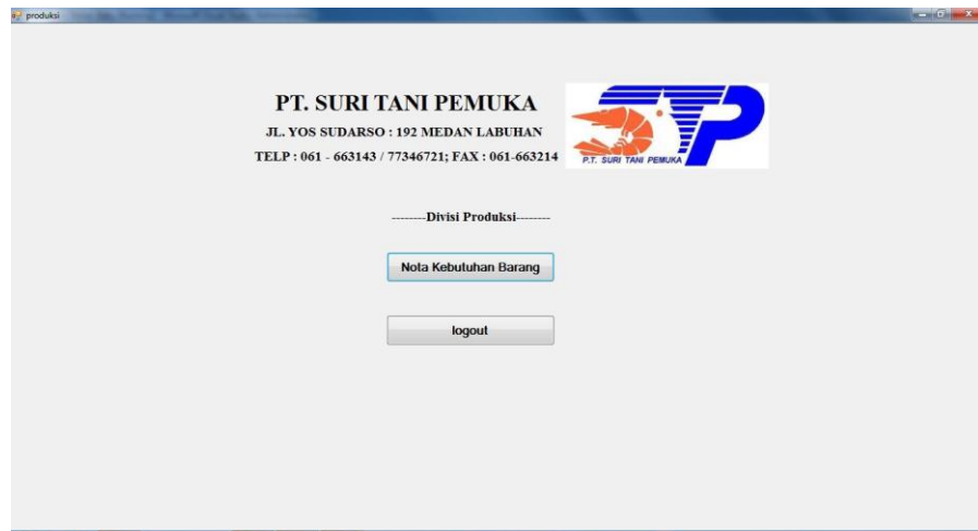
Gambar IV.2 : Tampilan Menu Utama Produksi