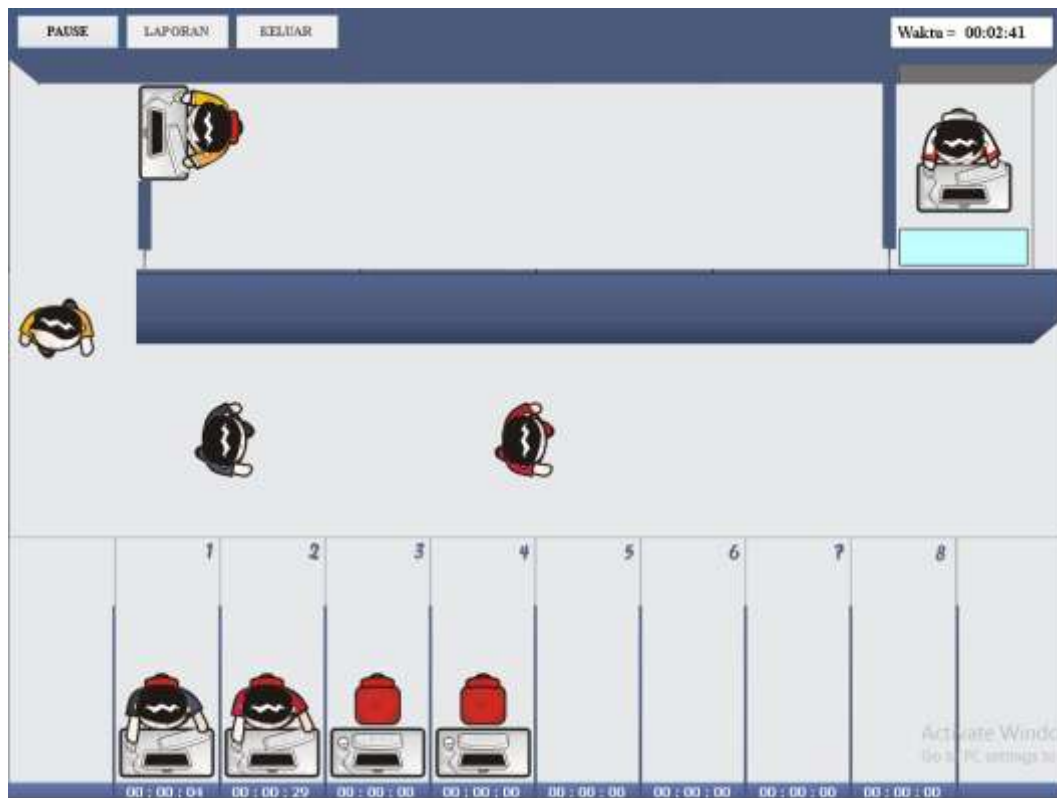
Gambar IV.4 Contoh Tampilan Simulasi Ketika Costumer Menggunakan Komputer Di Ruangn Warung Internet

Tampilan form laporan seperti terlihat pada gambar 4.5 berikut.