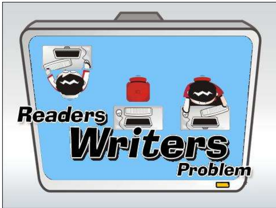
Gambar IV.1 Tampilan Splash Screen Ketika Dieksekusi

Contoh tampilan input adalah sebagai berikut: