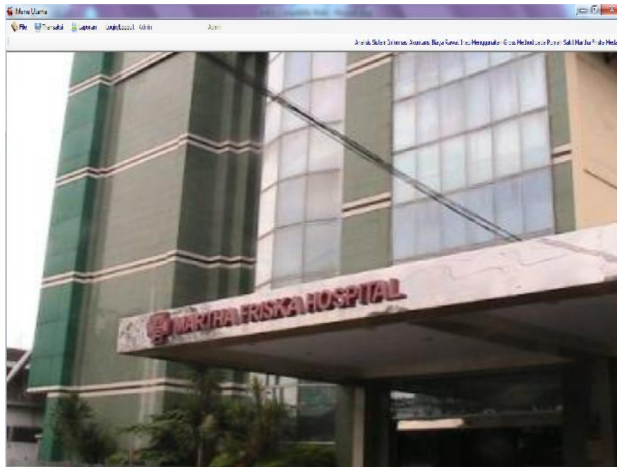
Gambar IV.2. Tampilan Form Menu Utama