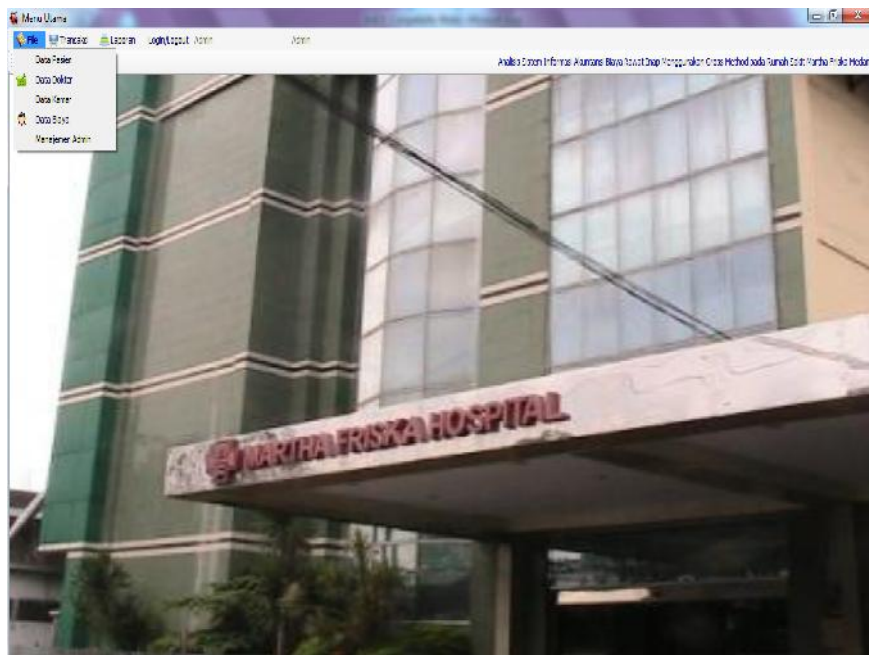
Gambar IV.3. Tampilan Form Menu File

Bentuk Tampilan form menu file dapat dilihat pada gambar dibawah ini.