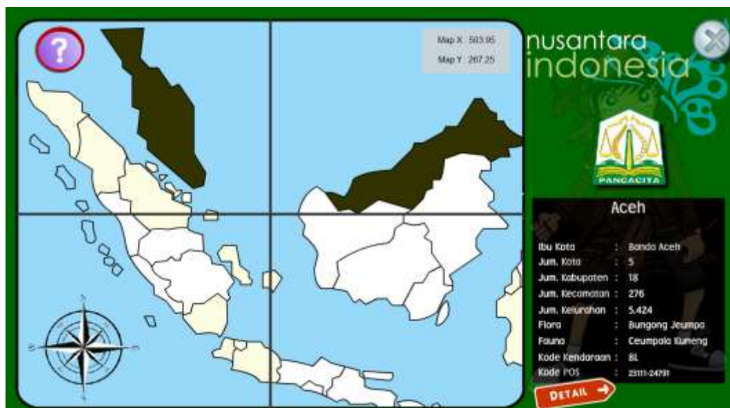
Gambar IV.3 Halaman Utama Pembelajaran

Setelah flash intro selesai jalan atau mau langsung masuk ke halaman utama bisa dilakukan dengan menekan tombol peta interaktif maka akan masuk kedalam halaman utama, berikut adalah halaman utama pembelajaran yang dibuat.