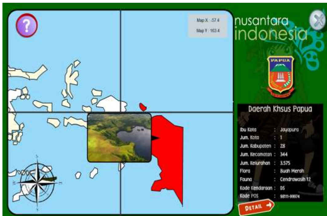
Gambar IV.8 Provinsi Papua

Sama seperti provinsi sumatera selatan, informasi provinsi papua juga ditampilkan pada bagian informasi sebelah kanan, untuk lebih jelasnya mengenai informasinya perhatikan gambar dibawah ini