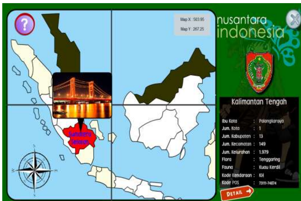
Gambar IV.4 Pembagian Provinsi

Gambar IV.3 merupakan halaman utama pembelajaran yang dirancang, dimana terdapat sebuah peta indonesia dengan pembagian daerah provinsi yang sudah dibuat penulis, untuk mengetahui provinsi apa pada peta cukup mengarahkan kursor pada peta dan akan menampilkan nama provinsi dan gambar berupa rumah daerah khas provinsi atau landmark provinsi tersebut, berikut gambarnya