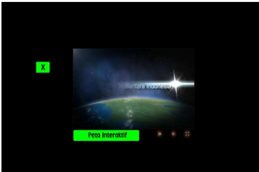
Gambar IV.1 Flash Intro

Pada bab ini, penulis akan menampilkan tampilan hasil perancangan yang telah dijelaskan pada bab sebelumnya.