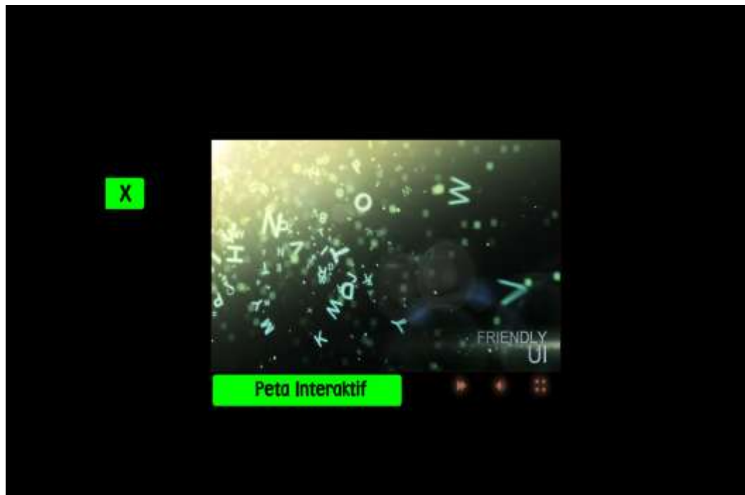
Gambar IV.2 Tampilan Flash Intro Lainnya

Setelah flash intro selesai jalan atau mau langsung masuk ke halaman utama bisa dilakukan dengan menekan tombol peta interaktif maka akan masuk kedalam halaman utama, berikut adalah halaman utama pembelajaran yang dibuat.