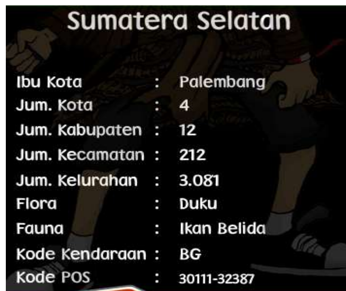
Gambar IV.6 Informasi Provinsi Sumatera Selatan

Gambar IV.5 menampilkan informasi umum mengenai provinsi Sumatera Selatan dan informasi umum ini berlaku untuk semua provinsi yang akan dipilih, untuk lebih jelasnya informasinya perhatikan gambar IV.6 berikut ini