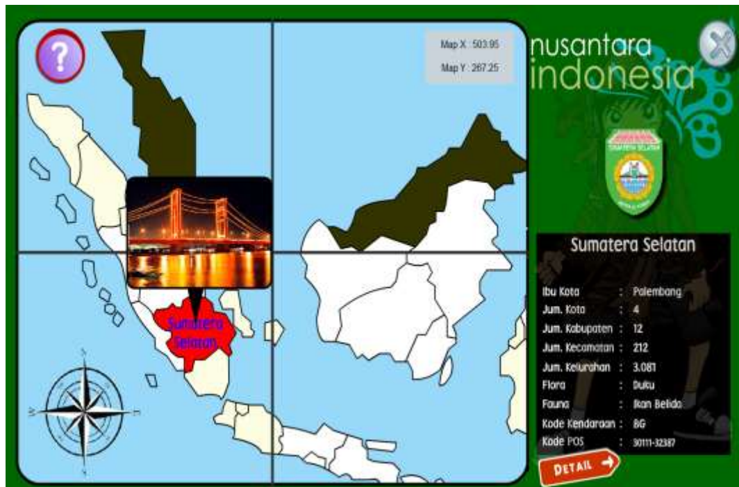
Gambar IV.5 Informasi Provinsi

Gambar IV.5 menampilkan informasi umum mengenai provinsi Sumatera Selatan dan informasi umum ini berlaku untuk semua provinsi yang akan dipilih, untuk lebih jelasnya informasinya perhatikan gambar IV.6 berikut ini