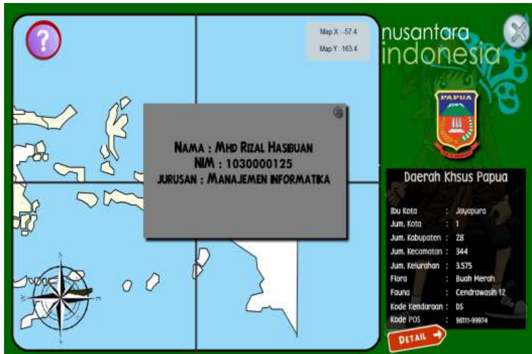
Gambar IV.10 Informasi Penulis

Setelah menampilkan informasi pada halaman utama, masih terdapat satu buah informasi lagi yaitu informasi penulis, berikut tampilannya