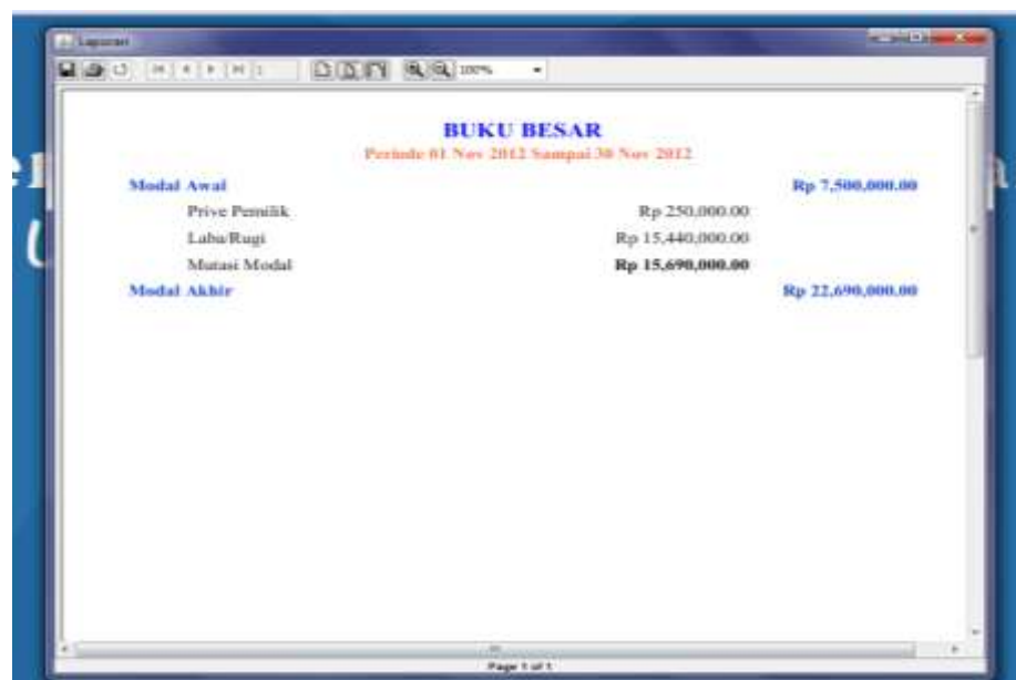
Gambar IV.10 Laporan Buku Besar

Laporan Buku besar kedua ini bertujuan untuk menampilkan dari modal awal dan modal akhir dari perusahaan. Seperti terlihat pada gambar IV.10 berikut: