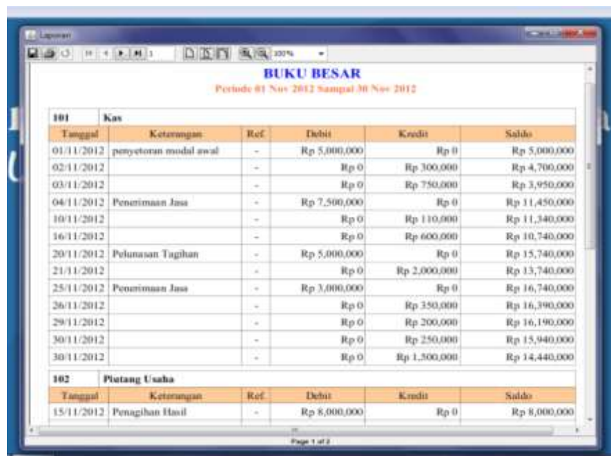
Gambar IV.8 Laporan Buku Besar

Laporan buku besar ini bertujuan untuk menampilkan mengenai data-data yang ada pada buku besar seperti tanggal, keterangan, debit kredit dan lain-lain. Seperti terlihat pada gambar IV.8 berikut :