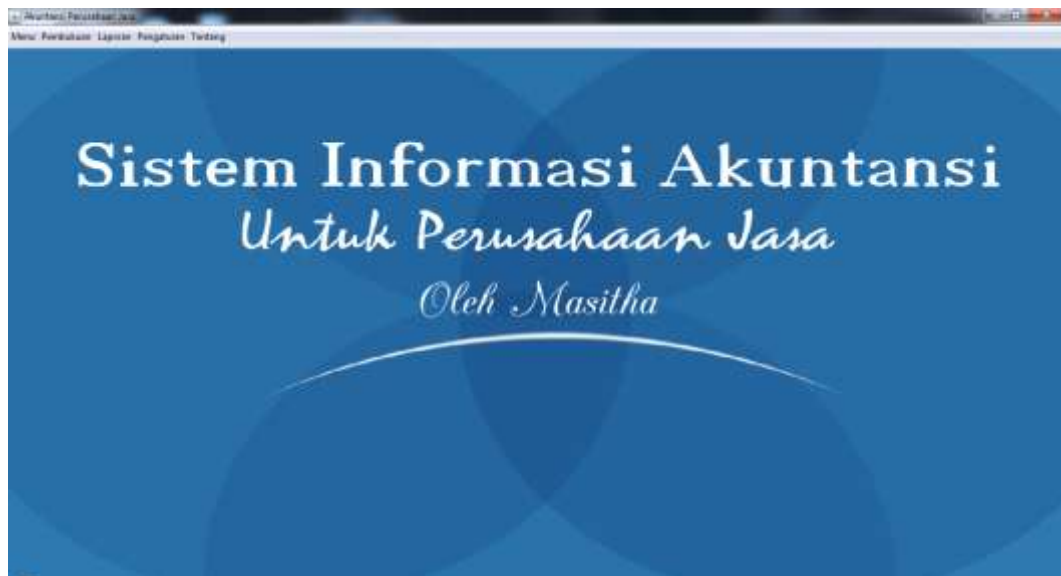
Gambar IV.1 Menu Utama

Tampilan ini merupakan tampilan awal pada saat aplikasi dijalankan dan merupakan suatu tampilan untuk menampilkan menu-menu lainnya yang ada didalam aplikasi ini. Seperti terlihat pada gambar IV.1 berikut :