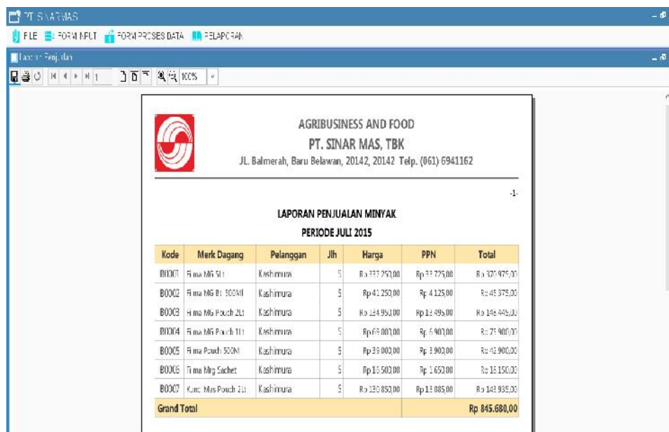
Gambar IV.17. Tampilan Report Penjualan Minyak

Tampilan report untuk penjualan minyak dapat terlihat seperti pada gambar berikut :