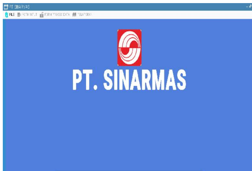
Gambar IV.1. Tampilan Form Menu Utama

Tampilan yang disajikan oleh sistem untuk melihat tampilan utama dapat terlihat seperti pada gambar IV.1 berikut :