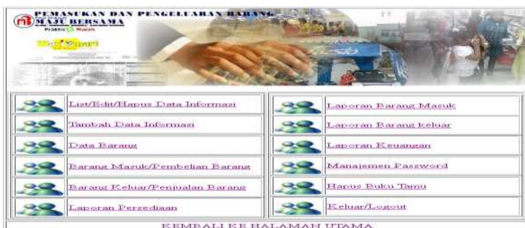
Gambar IV.5 Tampilan Halaman Administrator

Tampilan halaman Menu Admin merupakan halaman untuk memasukkan data dan informasi. Bentuk halaman menu admin dapat dilihat pada gambar dibawah ini.