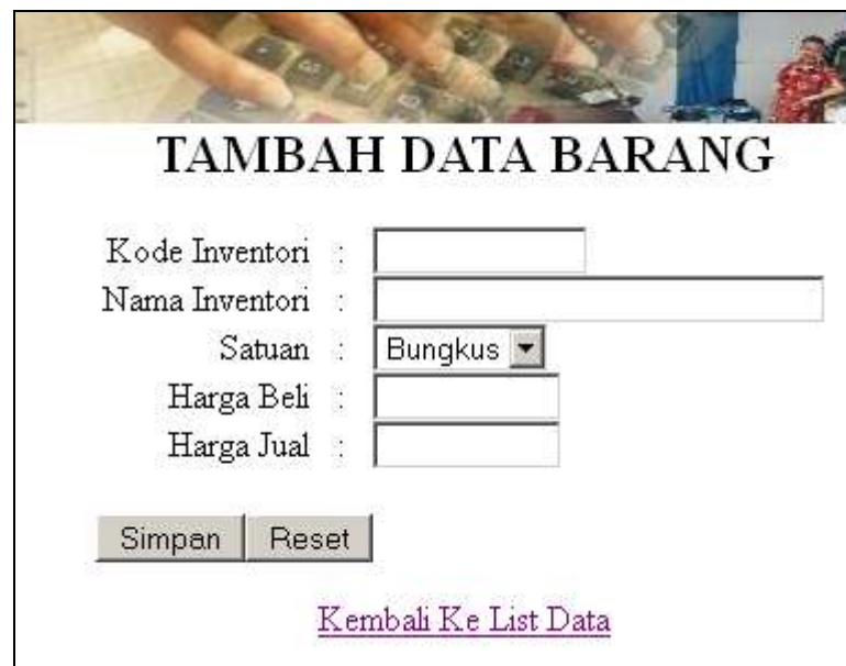
Gambar IV.7 Tampilan Halaman Input Data Barang