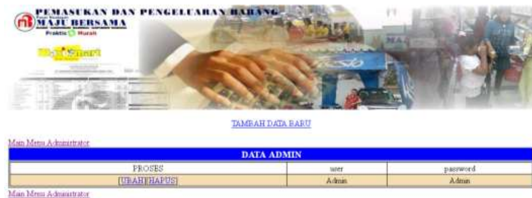
Gambar IV.12 Tampilan Halaman List Data Manajemen Password