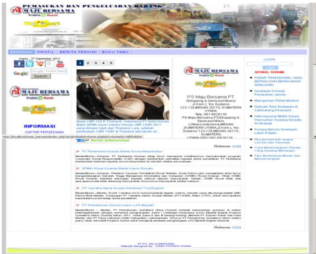
Gambar IV.1. Tampilan Halaman Utama

Halaman utama merupakan tampilan awal pada saat aplikasi dijalankan. Dalam halaman utama terdapat beberapa menu yang dapat diakses oleh pengunjung.