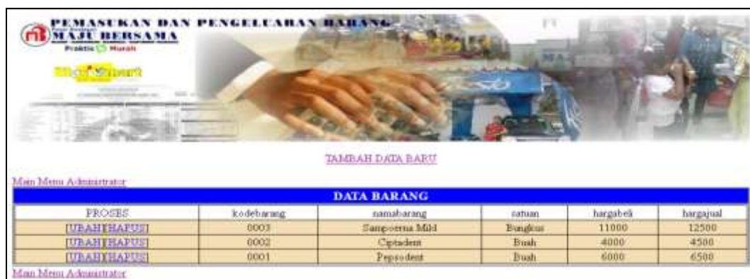
Gambar IV.8 Tampilan Halaman List Data Barang