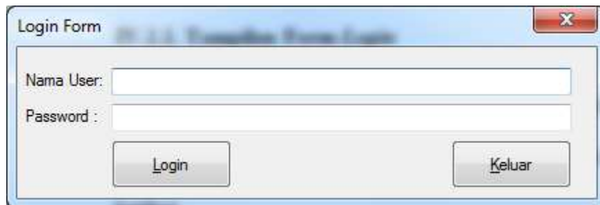
Gambar IV.1 Tampilan Form Login

Form login ini merupakan halaman untuk dapat masuk ke sistem dan mengoperasikannya. Berikut adalah form login seperti terlihat pada gambar IV.1 berikut :