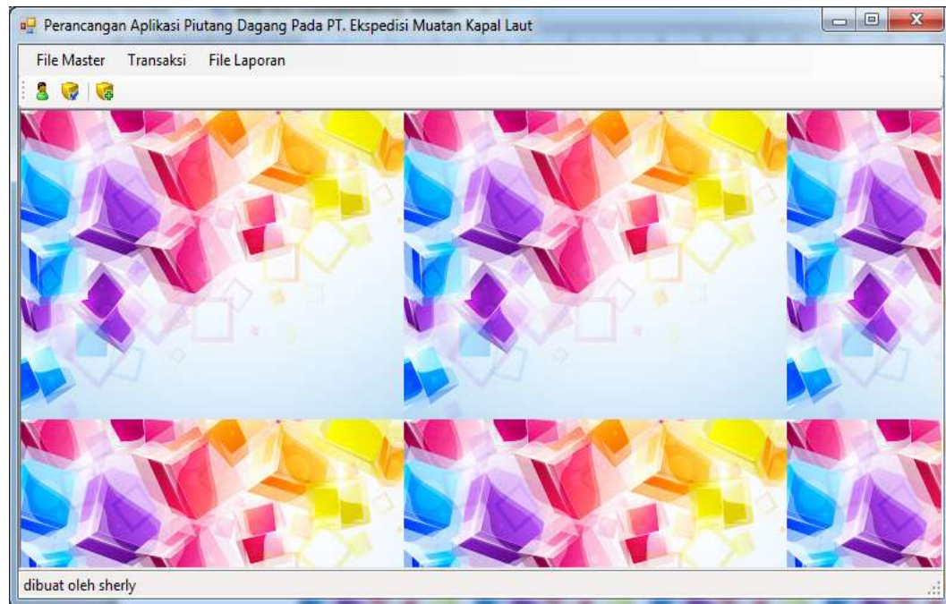
Gambar IV.2 Tampilan Menu Utama