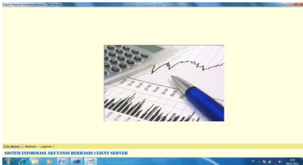
Gambar IV.2. Tampilan Menu Utama/Home

Halaman ini merupakan tampilan awal pada saat pengguna mengakses aplikasi sistem ini. Pada halaman ini akan menampilkan menu-menu yang ada pada aplikasi. Menu aplikasi seperti data setting perkiraan, Pencatatan Jurnal Umum, Neraca Harian, Laporan Neraca Saldo, Laporan laba rugi dan laporan neraca untuk user dapat dilihat pada gambar IV.2 berikut: