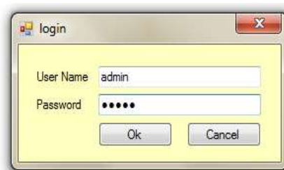
Gambar IV.1. Tampilan Halaman Login

Untuk dapat mengakses informasi mengenai transaksi keuangan maka harus memiliki hak akses sesuai dengan data pengguna. Masuk sebagai user, maka user harus melakukan login dahulu yaitu dapat dilihat pada gambar IV.1 berikut :