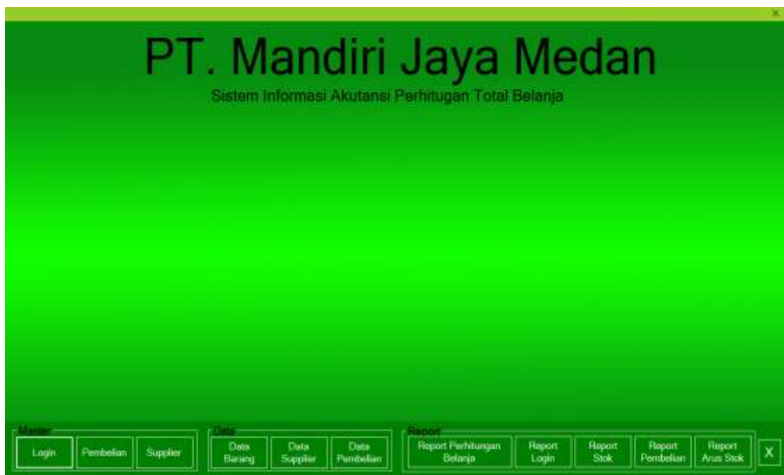
Gambar IV.2. Tampilan Antarmuka Menu Utama

Menu utama ini adalah menu utama yang ditampilkan pada sistem pendukung keputusan yang dibangun. Di dalam menu utama ini terdapat 11 (sebelas) fasilitas yang disediakan, diantaranya adalah Login, Pembelian, Supplier, Data barang, Data Supplier, Data pembelian, Report perhitungan belanja, Report login, Report stok, Report pembelian, Report arus stok. Gambar tampilan antarmuka menu utama dapat dilihat pada gambar IV.2 :