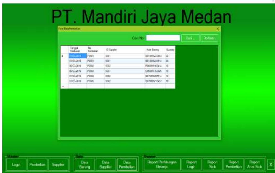
Gambar IV.5. Tampilan Antarmuka Data Barang

Tampilan antarmuka data barang ini adalah form yang dibangun untuk menampilkan data barang yang ada pada PT. Mandiri Jaya Medan. Didalam form ini terdapat 2 (dua) fasilitas yang disediakan dalam bentuk button diantaranya cari dan refresh. Gambar tampilan antarmuka data barang ditunjukkan pada gambar IV.5 :