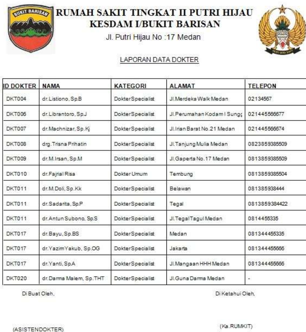
Gambar IV.8. Laporan Data Dokter

Pada saat diklik laporan data dokter kemudian muncul nama-nama dokter. Laporan ini memudahkan pengguna untuk mengetahui nama dokter, alamat, kategori dokter, dan nomor telp yang bisa dihubungi. Berikut tampilan output dari laporan Data Dokter pada gambar IV. 8: