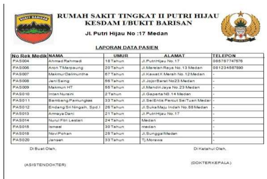
Gambar IV.7. Laporan Data Pasien

Pada saat diklik laporan data pasien kemudian muncul nama-nama pasien. Laporan ini memudahkan pengguna untuk mengetahui nama pasien, alamat dan nomor telp yang bisa dihubungi. Berikut tampilan output dari laporan Data Pasien pada gambar IV. 7 :