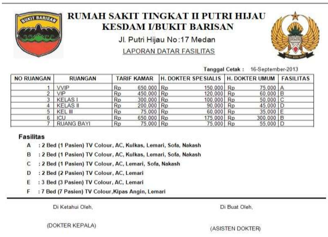
Gambar IV.11. Laporan Daftar Fasilitas

Laporan ini menunjukkan tentang informasi fasilitas yang ada pada Rumah Sakit Tk II Putri Hijau Kesdam I/Bukit Barisan, berikut tampilan output dari laporan Daftar Fasilitas pada gambar IV.11 :