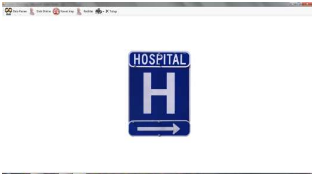
Gambar IV.2. Tampilan Menu Utama/Home

Halaman ini merupakan tampilan awal pada saat pengguna mengakses aplikasi sistem ini. Pada halaman ini akan menampilkan menu-menu yang ada pada aplikasi. Menu aplikasi seperti form data pasien, data dokter, data rawat inap, serta data kwitansi penerimaan dapat dilihat pada gambar IV.2 berikut: