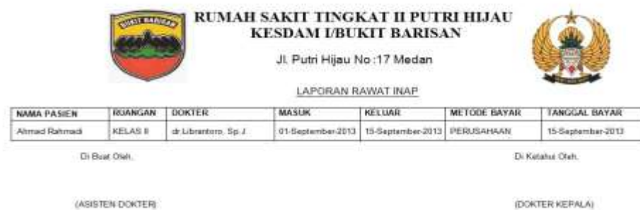
Gambar IV.9. Laporan Data Rawat Inap

Pada saat diklik pada laporan muncul laporan data Rawat Inap yang dapat memudahkan mengetahui berapa banyak pasien yang telah dimasukkan ke dalam laporan tersebut. Berikut tampilan output dari laporan Data Rawat Inap pada gambar IV.9 :