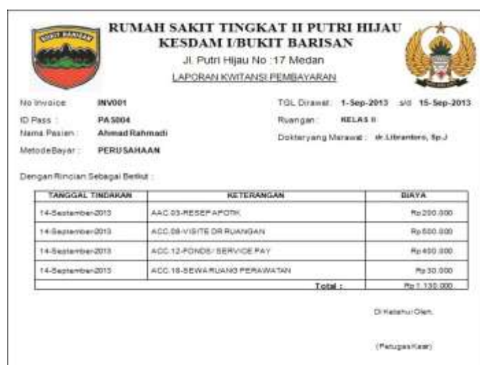
Gambar IV.10. Laporan Kwitansi Pembayaran

Laporan Kwitansi Pembayaran menunjukkan daftar biaya-biaya yang harus dibayar oleh pasien. Berikut tampilan output dari laporan Kwitansi Pembayaran pada gambar IV.10 :