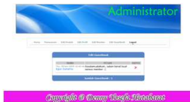
Gambar IV.14. Halaman Edit Guestbook