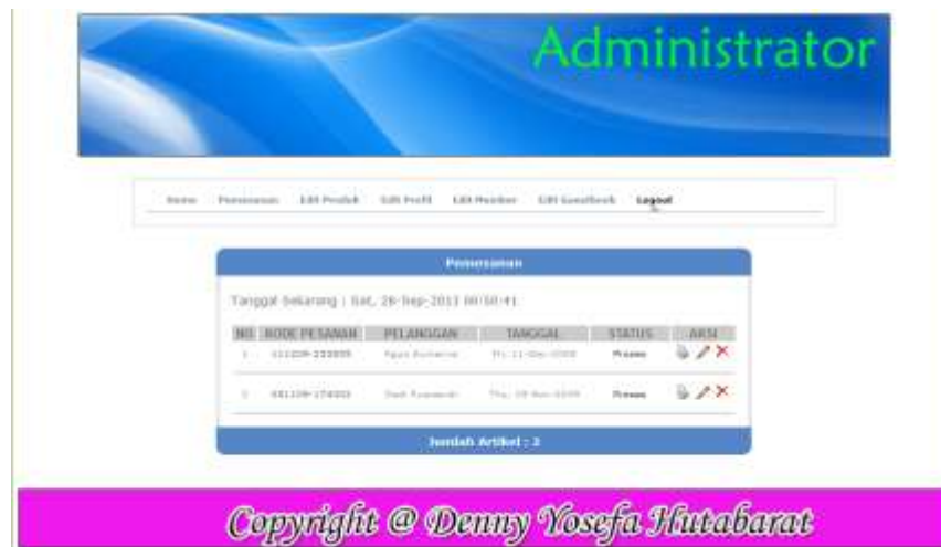
Gambar IV.10. Halaman Pemesanan