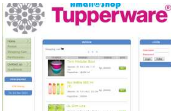
Gambar IV.2. Tampilan Halaman Produk