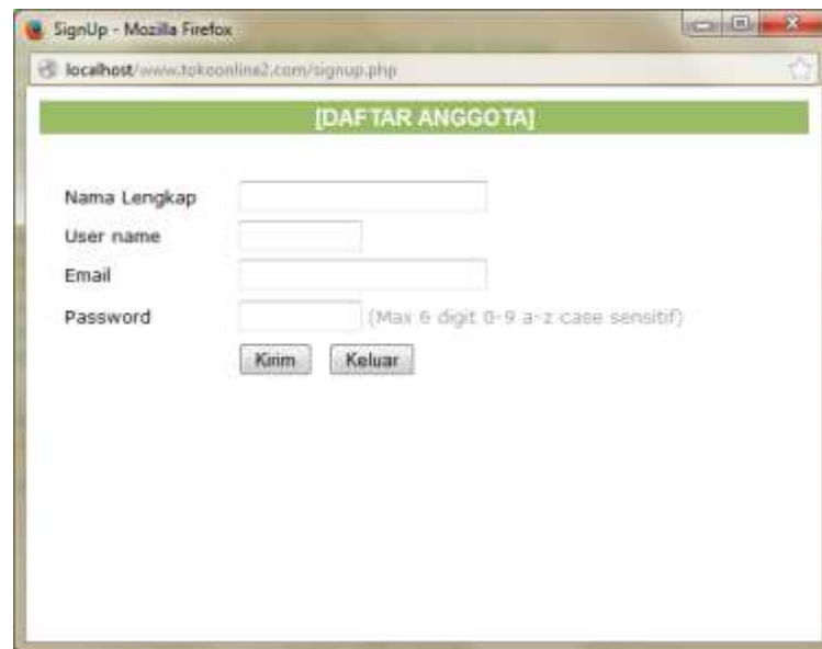
Gambar IV.7. Halaman Daftar Member