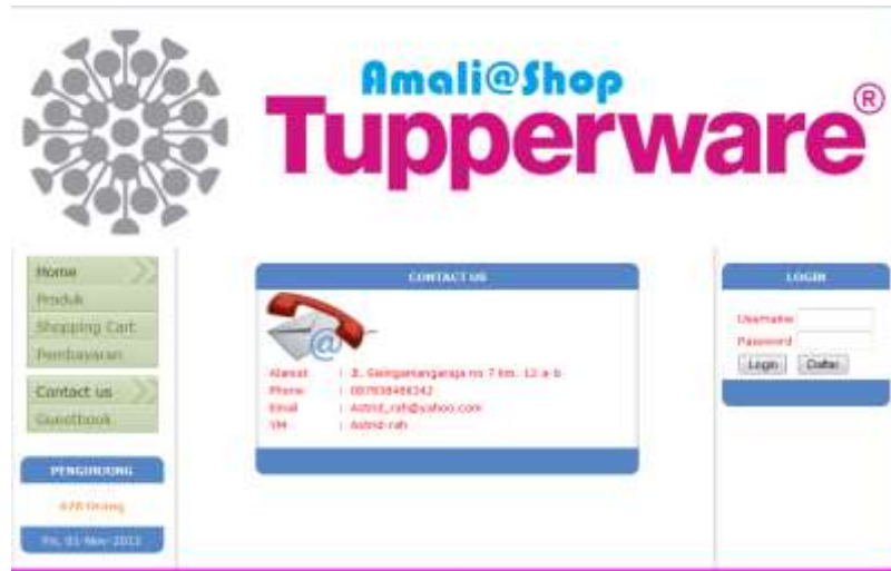
Gambar IV.5. Tampilan Halaman Kontak