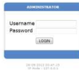
Gambar IV.8. Halaman Login Admin