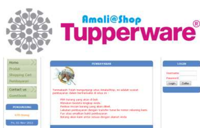
Gambar IV.4. Tampilan Halaman Pembayaran