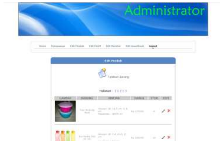
Gambar IV.11. Halaman Edit Produk