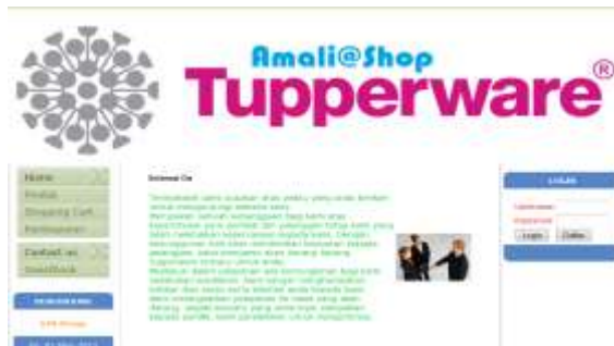
Gambar IV.1. Tampilan Halaman Utama