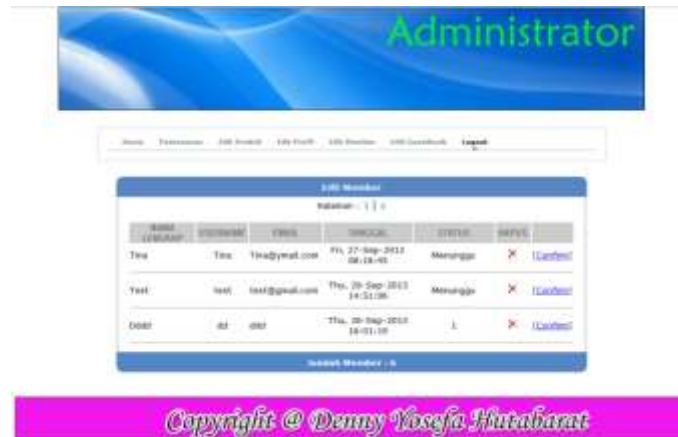
Gambar IV.13. Halaman Edit Member