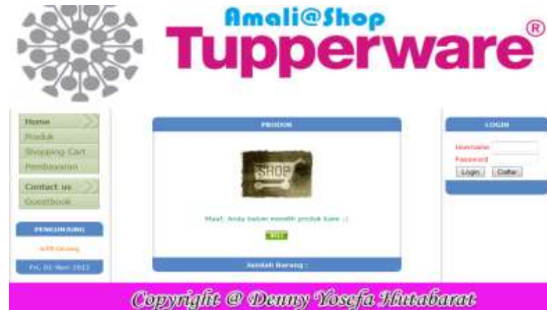
Gambar IV.3. Tampilan Halaman Shopping Chart