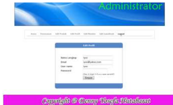
Gambar IV.12. Halaman Edit Profil