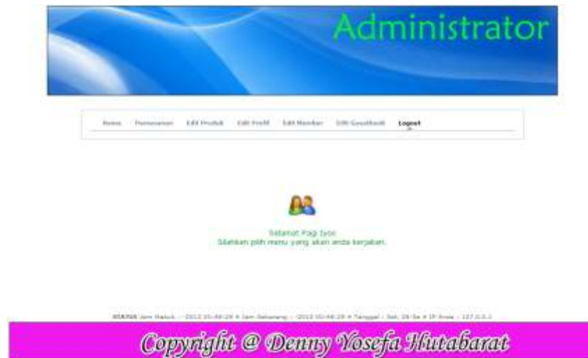
Gambar IV.9. Halaman Home Admin