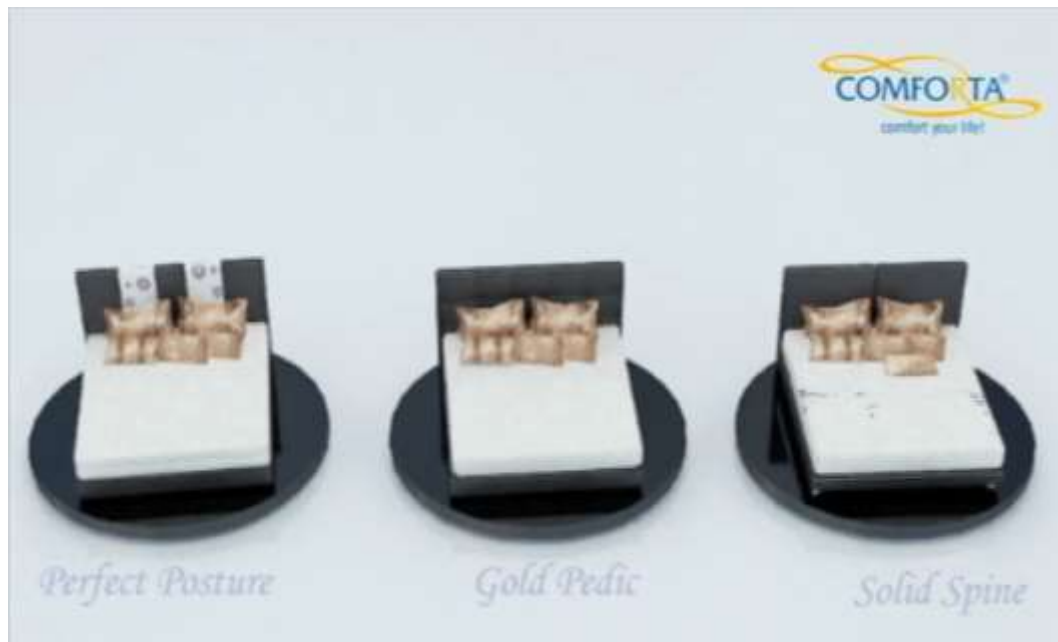
Gambar IV.3 Tampilan Desain dari beberapa jenis produk Springbed Comforta

Kemudian berikut ini akan ditampilkan dari beberapa jenis produk Springbed Comforta setelah dirender.