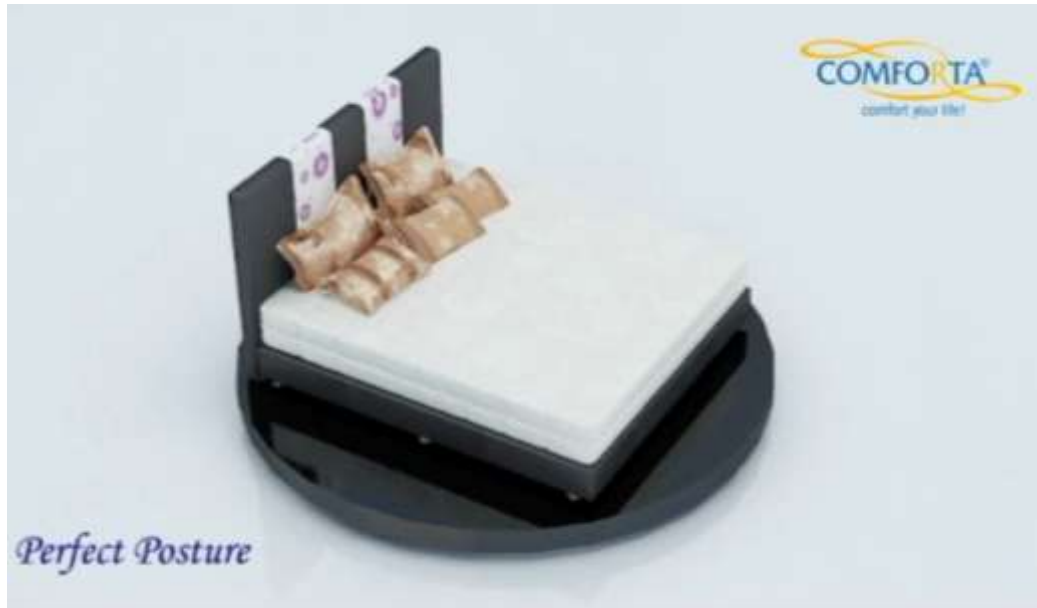
Gamar IV.2 Tampilan Desain Springbed

Berikut ini akan ditampilkan beberapa tampilan animasi iklan yang telah di buat setelah dirender.