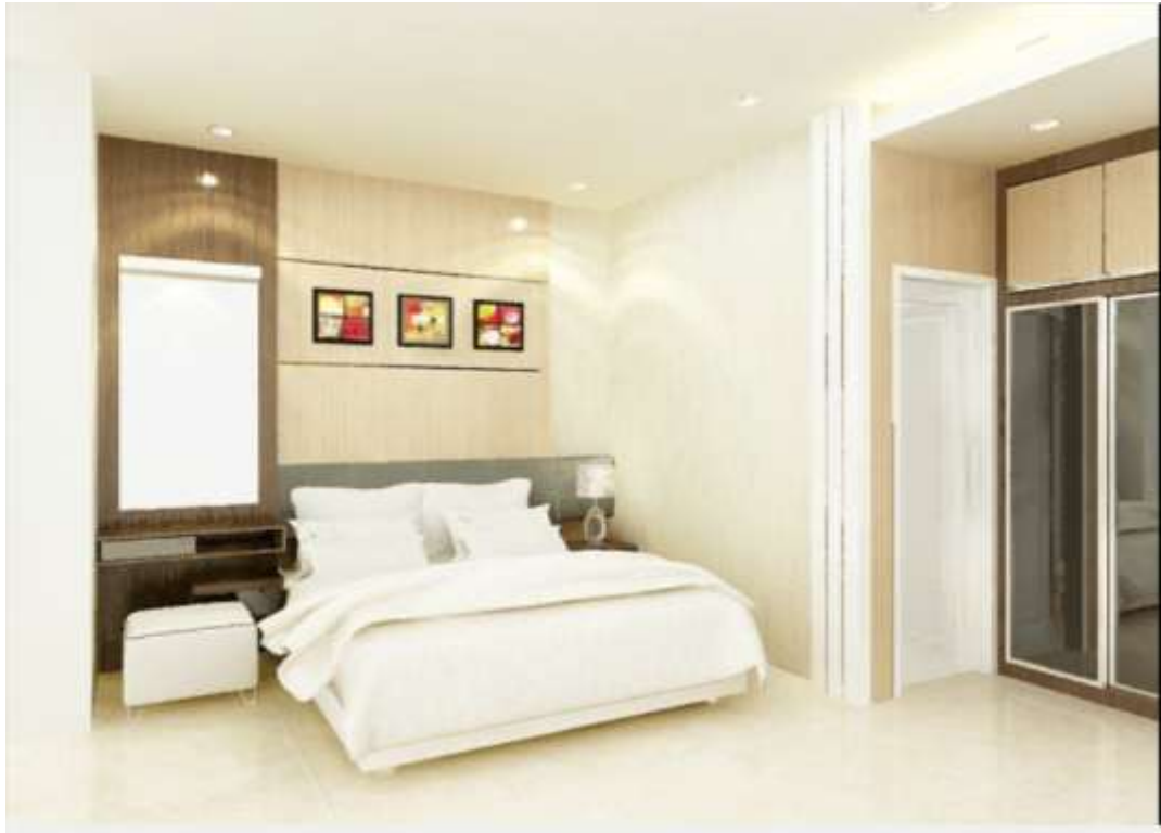
Gambar IV.4 Tampilan Interior Kamar

Pada tampilan ini terlihat desain interior kamar yang didesain semenarik dan seindah mungkin agar konsumen tertarik.