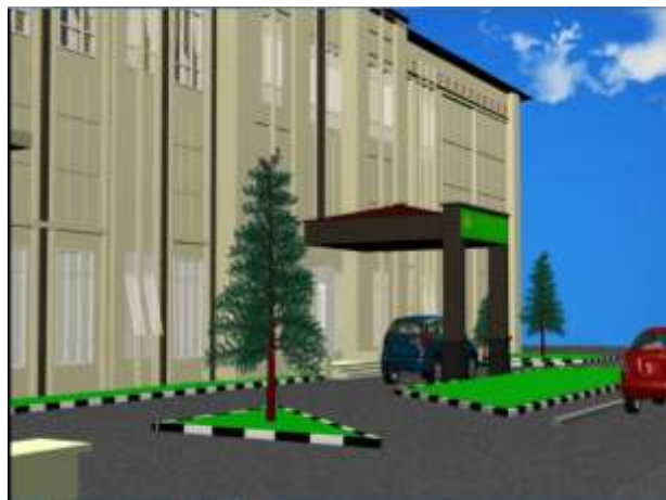
Gambar IV.2. Tampilan Tampak Gedung STIKes

Tampilan tampak gedung STIKes dengan objek 3D.