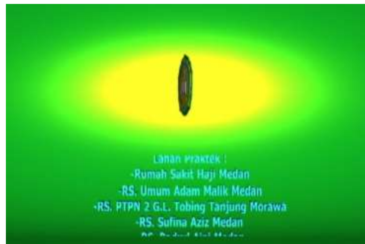
Gambar IV.10. Tampilan Tampak Lahan Praktek

Pada tampilan ini terlihat teks lahan praktek berbentuk tiga dimensi dan proses animasi teks berjalan.