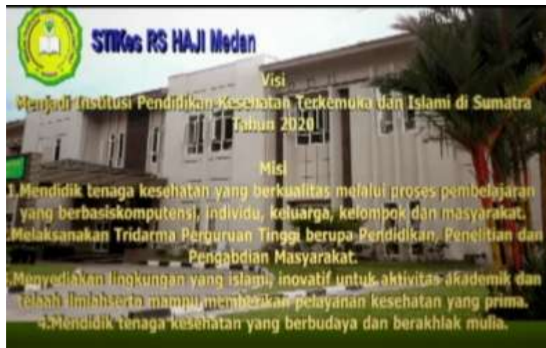
Gambar IV.4. Tampilan Tampak Visi dan Misi

Pada tampilan ini terlihat teks visi dan misi berbentuk tiga dimensi dan proses animasi teks berjalan.