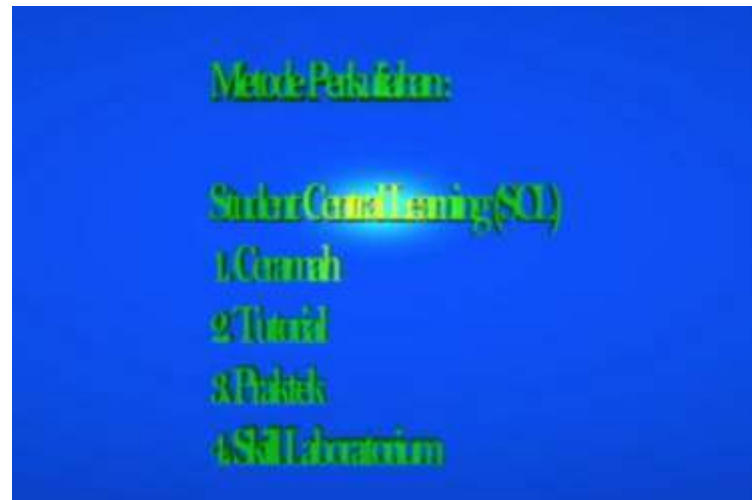
Gambar IV.9. Tampilan Tampak Metode Perkuliahan

Pada tampilan ini terlihat teks metode perkuliahan berbentuk tiga dimensi dan animasi teks meledak.