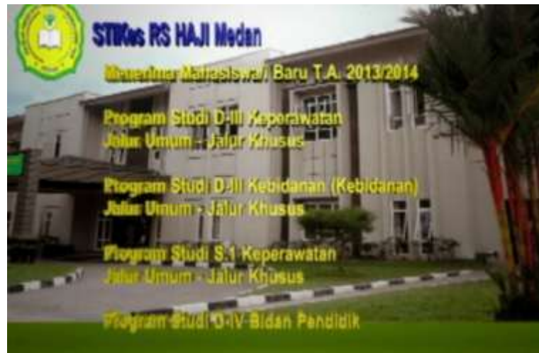
Gambar IV.3. Tampilan Tampak Program Studi

Pada tampilan ini terlihat teks program studi berbentuk tiga dimensi dan proses animasi teks berjalan.