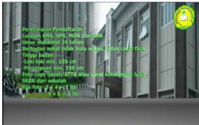
Gambar IV.6. Tampilan Tampak Persyaratan Pendaftaran

Pada tampilan ini terlihat teks persyaratan pendaftaran berbentuk tiga dimensi dan proses animasi teks berjalan.