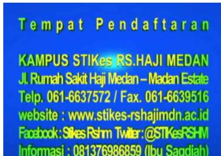
Gambar IV.14. Tampilan Tampak Tempat Pendaftaran

Pada tampilan ini terlihat teks tempat pendaftaran berbentuk tiga dimensi dan animasi teks meledak.