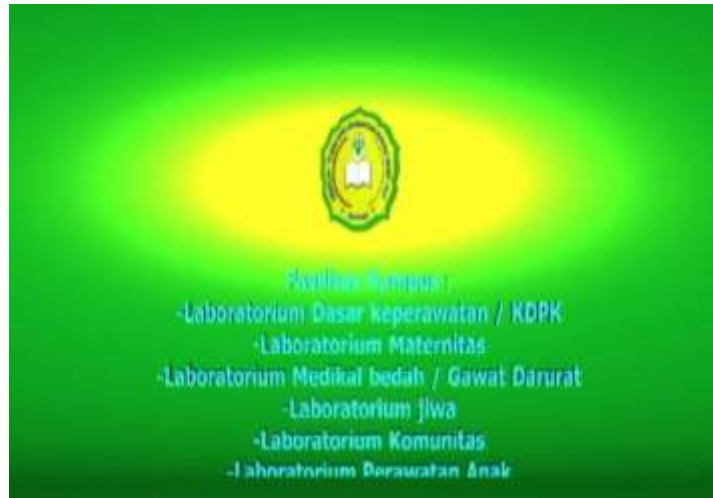
Gambar IV.11. Tampilan Tampak Fasilitas Kampus

Pada tampilan ini terlihat teks fasilitas kampus berbentuk tiga dimensi dan proses animasi teks berjalan.