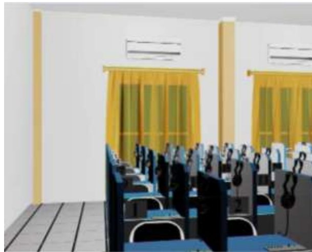
Gambar IV.12. Tampilan Tampak Ruang Lab Bahasa

Pada tampilan ini terlihat interior ruang lab bahasa berbentuk objek 3D dan proses animasi video yang menampilkan ruangan tersebut.