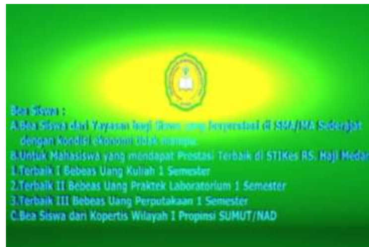
Gambar IV.8. Tampilan Tampak Bea Siswa

Pada tampilan ini terlihat teks bea siswa berbentuk tiga dimensi dan proses animasi teks berjalan.