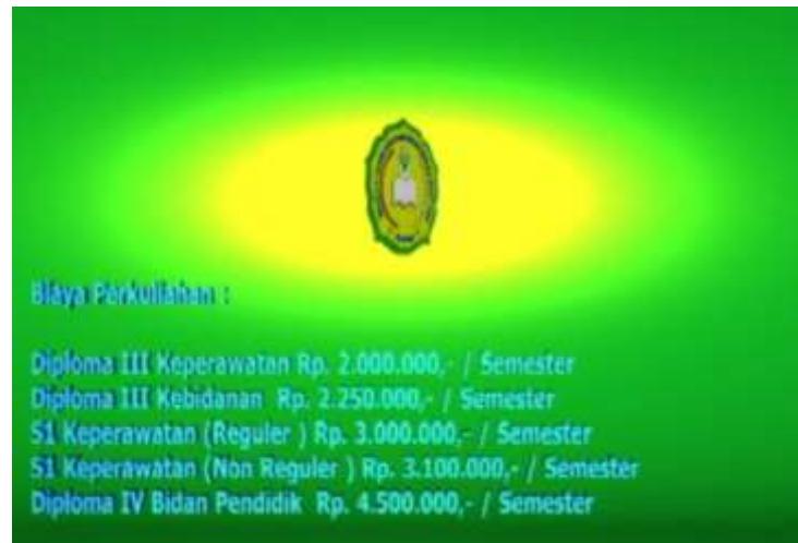
Gambar IV.7. Tampilan Tampak Biaya Kuliah

Pada tampilan ini terlihat teks biaya kuliah berbentuk tiga dimensi dan proses animasi teks berjalan.