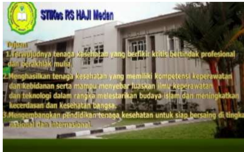
Gambar IV.5. Tampilan Tampak Tujuan

Pada tampilan ini terlihat teks tujuan berbentuk tiga dimensi dan proses animasi teks berjalan.