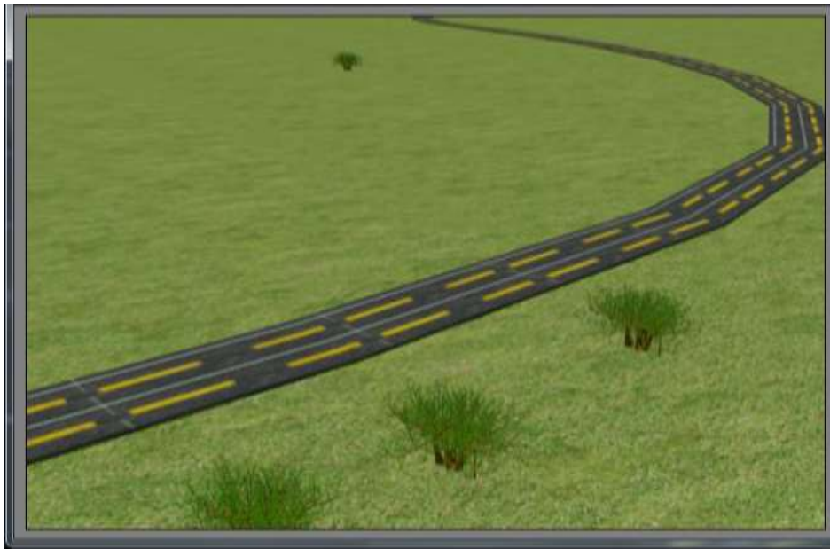
Gambar IV.2. Tampilan Lintasan Mobil

Sebagian dari tampilan lintasan mobil yang di buat mengarah ke lintasan kereta api, lihat Gambar IV.2.