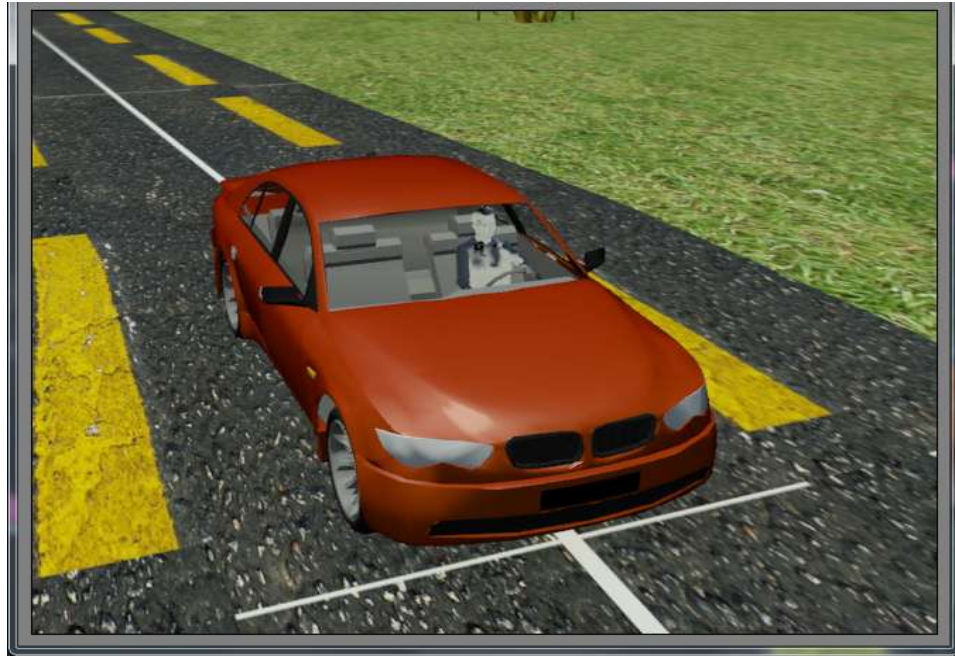
Gambar IV.3. Tampilan Mobil