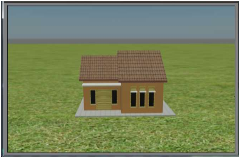
Gambar IV.1. Tampilan Salah Satu Rumah

Tampilan salah satu rumah penduduk yang berada di pinggir jalan, lihat Gambar IV.1.