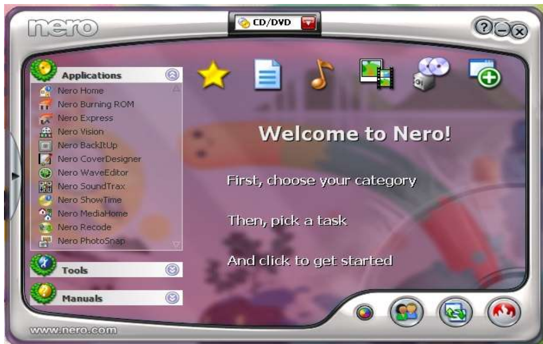
Gambar IV.5. Jendela Kerja Nero