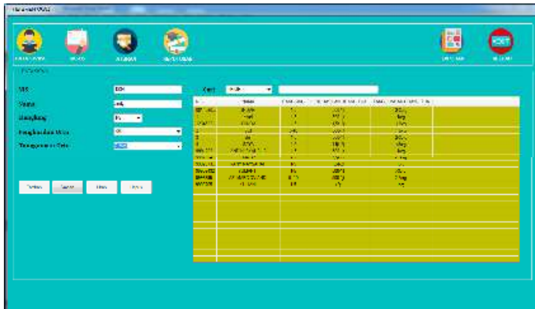
Gambar IV.3 Tampilan Halaman Siswa

Gambar IV.3 menjelaskan bahwa admin dapat memasukkan data siswa mulai dari nis, nama, rangking, penghasilan orangtua, tanggungan orangtua dan dilengkapi dengan tombol aksi yaitu tambah, simpan, ubah, hapus dan ListView .