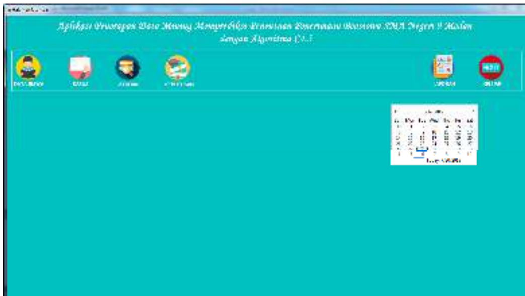
Gambar IV.2 Tampilan Halaman Utama

Tampilan menu utama terdiri dari beberapa menu yang berfungsi sebagai pusat seluruh program admin. Untuk lebih jelasnya dapat dilihat pada Gambar IV.2 :