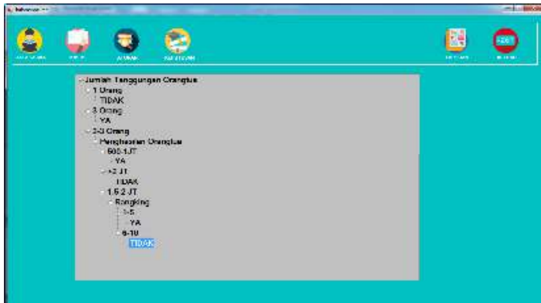
Gambar IV.5. Tampilan Halaman Aturan

Gambar IV.5 menjelaskan admin dapat melihat dan menentukan hasil penerima beasiswa melalui hasil pohon keputusan yang telah dihitung. Dalam tampilan ini penulis menggunakan TreeView .