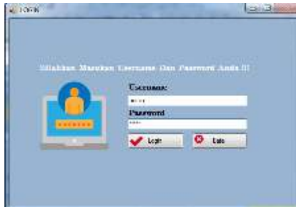
Gambar IV.1 Tampilan Login

Tampilan halaman login terdiri dari beberapa tombol yaitu tombol “Login” dan tombol “batal”. Untuk lebih jelasnya dapat dilihat pada gambar IV.1 :