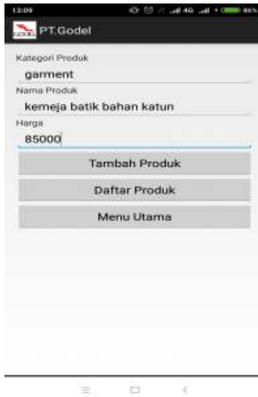
Gambar IV.3 Tampilan Form Tambah Produk