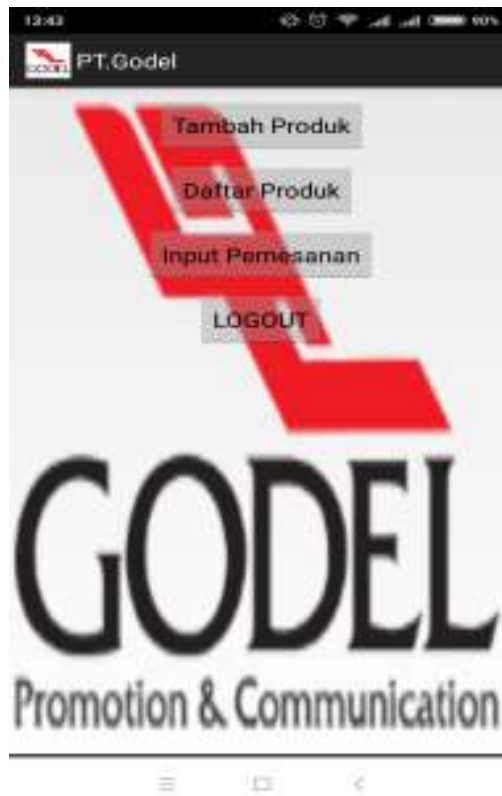
Gambar IV.2 Tampilan Form Menu Utama