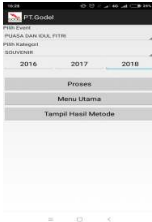
Gambar IV.6 Tampilan Form Peramalan