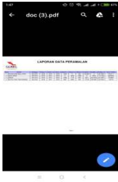
Gambar IV.7. Tampilan Form Laporan Peramalan