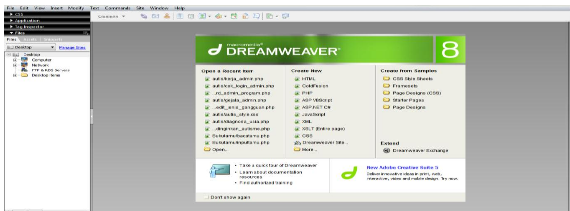
Gambar II.2. Tamnilan Awal Macromedia Dreamweaver 8 (sumber : Bunafit Nugroho ; 2009 : 4)

Berikut ini akan ditampilkan halaman awal dan area kerja pada Dreamweaver 8: