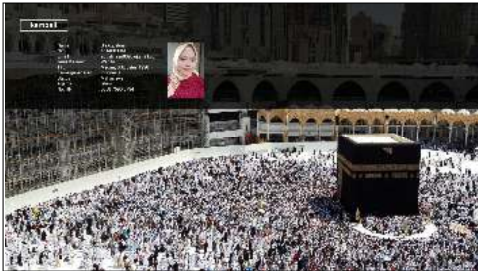
Gambar IV.3. Tampilan Layar Form Profil

Form Tentang adalah halaman profil yang menyediakan satu pilihan opsi yaitu kembali dan proses dilanjutkan pada opsi pihan kembali tersebut yang berfungsi untuk kembali ke menu utama pada aplikasi tata cara pelaksanaan haji dan umrah berbasis multimedia.