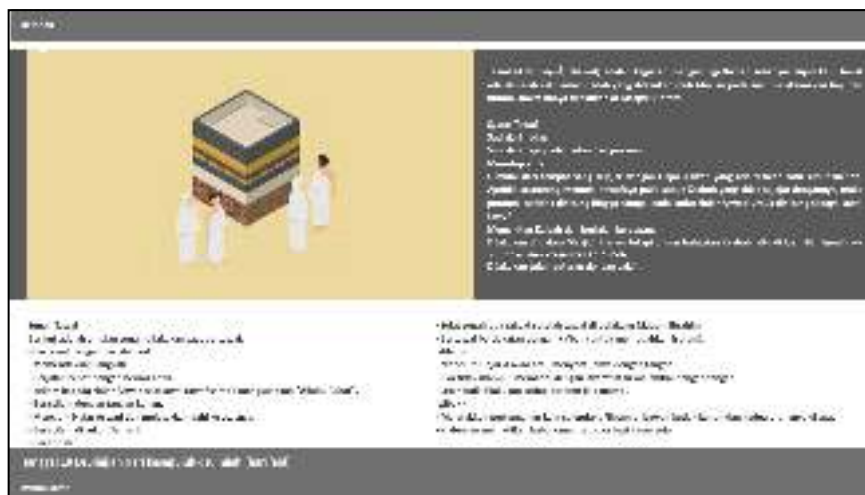
Gambar IV.9 Tampilan Layar Form Penjelasan

Gambar dibawah ini adalah interface dari form penjelasan dari hasil proses seleksi salah ikon penjelasan yang ditampilkan dan pada form ini adalah penjelasan masing-masing ikon terseleksi. Pada form ini memiliki satu opsi pilihan yaitu menu utama. Proses dilanjutkan pada pilihan menu utama untuk kembali ke menu form tata cara haji dan umrah pada aplikasi tata cara pelaksanaan haji dan umrah berbasis multimedia.