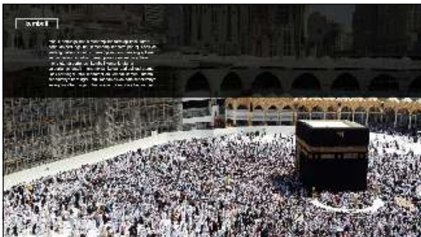
Gambar IV.2. Tampilan Layar Form Panduan

Form petunjuk adalah halaman panduan yang berfungsi sebagai petunjuk penggunaan aplikasi yang menyediakan satu pilihan opsi yaitu kembali dan proses dilanjutkan pada opsi pilihan kembali tersebut yang berfungsi untuk kembali ke menu utama pada aplikasi tata cara pelaksanaan haji dan umrah.