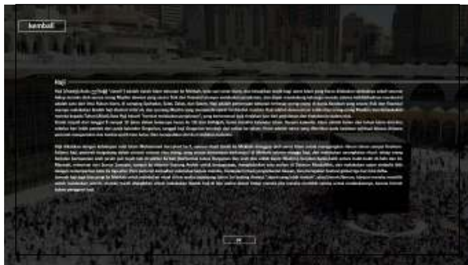
Gambar IV.5. Tampilan Layar Form Lanjutan Haji

Form Lanjutan Haji adalah form lanjutan haji yang ditampilkan yang menyediakan dua opsi pilihan yaitu kembali dan ok, proses dilanjutkan pada opsi pilihan ok yang berfungsi untuk menampilkan form tata cara haji, pada form ini terdapat penjelasan tentang haji dan keluar yang berfungsi kembali ke form menu utama pada aplikasi tata cara pelaksanaan haji dan umrah berbasis multimedia.