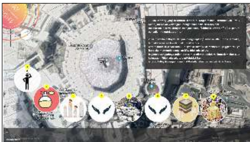
Gambar IV.8. Tampilan Layar Form Tata Cara Umrah

Gambar dibawah ini adalah interface dari form tata cara umrah yang memiliki dua opsi pilihan yaitu ikon penjelasan dan menu utama. Proses dilanjutkan pada opsi pilihan tanggal dan ikon penjelasan yang berfungsi untuk menampilkan lompatan hari dan penjelasan spesifik pada tata cara umrah pada aplikasi tata cara pelaksanaan haji dan umrah berbasis multimedia.