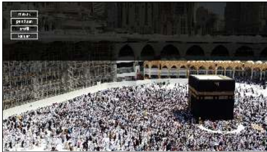
Gambar IV.1. Tampilan Layar Menu Utama