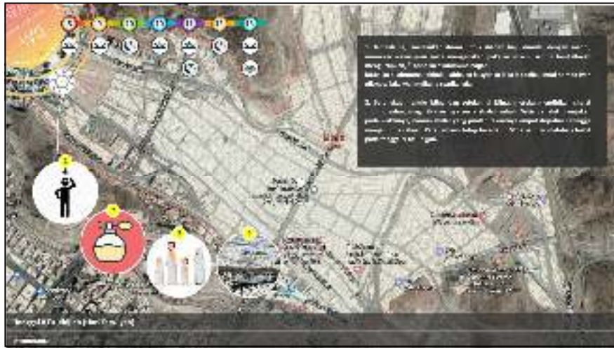
Gambar IV.7. Tampilan Layar Form Tata Cara Haji