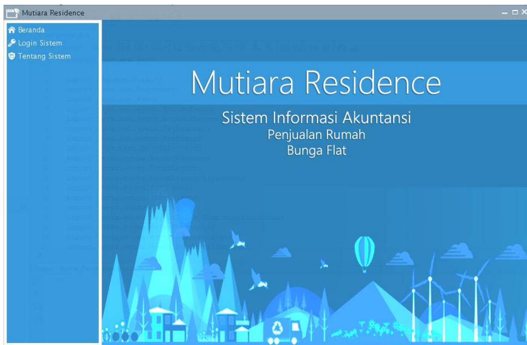
Gambar IV.1. Tampilan Form Start Up

Tampilan start up sistem dapat terlihat seperti pada gambar IV.1 berikut :