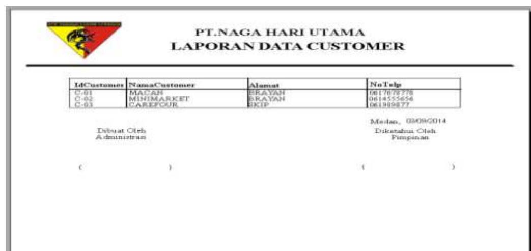
Gambar IV.11. Tampilan Laporan Customer

Adapun hasil tampilan laporan Data Customer yang penulis buat dapat dilihat pada gambar IV.11. sebagai berikut :