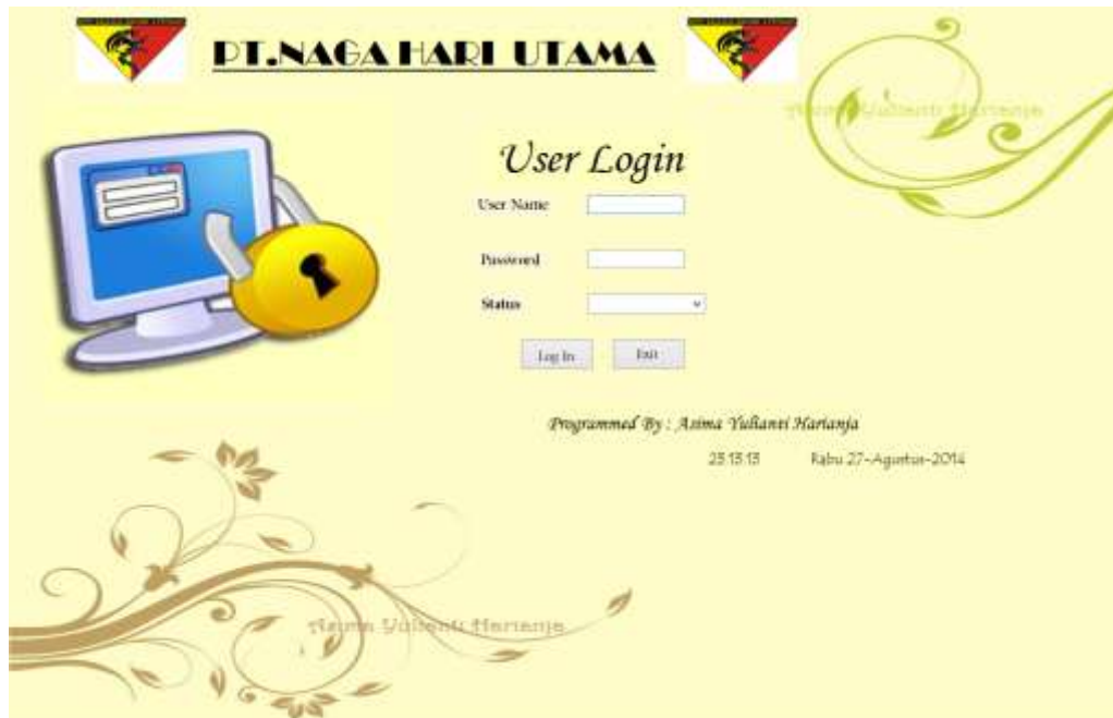
Gambar IV.1. Tampilan Form Login

Tampilan Form Login ini merupakan halaman untuk dapat masuk ke sistem dan mengoperasikannya, seperti terlihat pada gambar IV.1