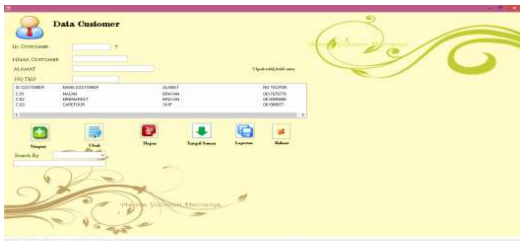
Gambar IV.5. Tampilan Input Data Customer

Adapun hasil tampilan input Data Customer yang penulis buat dapat dilihat pada gambar IV.5. sebagai berikut :