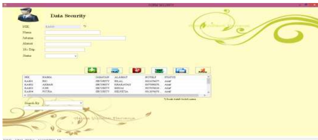
Gambar IV.4. Tampilan Input Data Security

Adapun hasil tampilan input Data Security yang penulis buat dapat dilihat pada gambar IV.4. sebagai berikut :