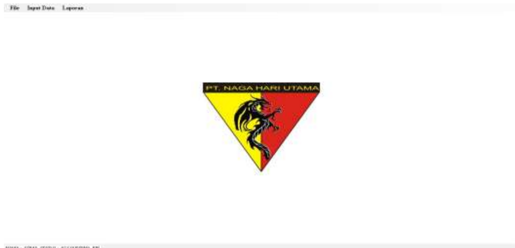
Gambar IV.2. Tampilan Form Menu Utama

Adapun hasil tampilan Menu Utama PT.Naga Hari Utama yang penulis buat dapat dilihat pada gambar IV.2. sebagai berikut :