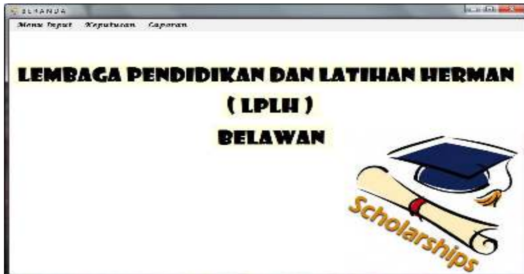
Gambar IV.2: Halaman Beranda

Tampilan halaman beranda dapat dilihat pada Gambar IV.2.