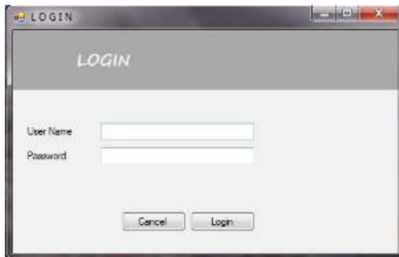
Gambar IV.1: Halaman Login

Berikut ini merupakan tampilan halaman login dari Sistem Pendukung Keputusan yang dibangun. Adapun halaman login pada Gambar IV.1