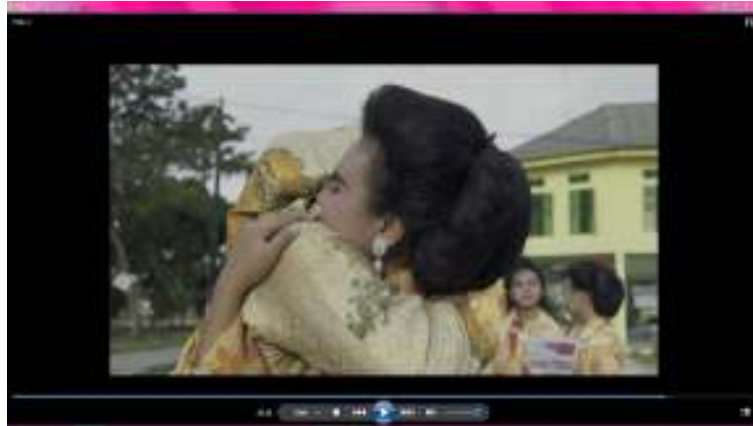
Gambar IV.15. Potongan gambar pada film lesTARI Pada menit (00.23.59-00.26.19) (Sumber: Screenshot film lesTARI, 2019)

Pada bagian ini sangat terasa janggal terlihat karena posisi kedua objek yaitu Tari dan ibunya yang sedang berpelukan sangat terlihat aneh ketika saat mereka berputar, sangat terlihat ganjal dengan pengambilan gambar seperti ini, yang seharusnya berputar itu adalah kamera tetapi disini yang memutar adalah objek, sangat disayangkan sehingga penonton kurang mendapatkan feel pada adegannya. Dan yang membuatnya penonton mengerti bahwa objek yang berputar dari segi putarannya tertatih-tatih terlihat goyangnya sangat beda dengan kamera yang berputar mungkin gambar akan terlihat lebih smooth .