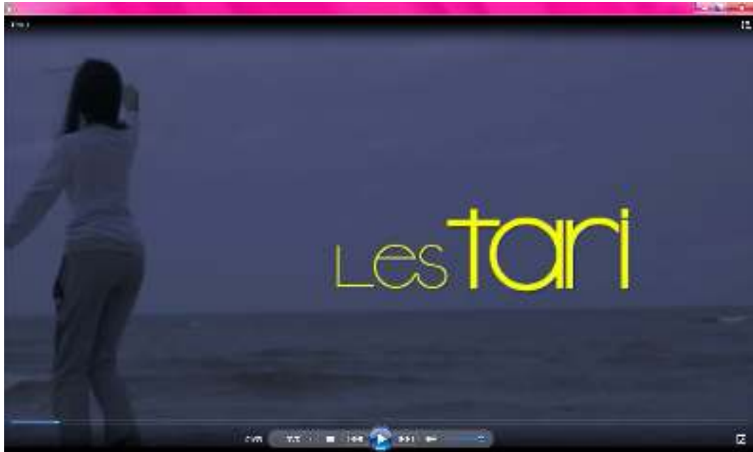
Gambar IV.2. Cover pada film lesTARI