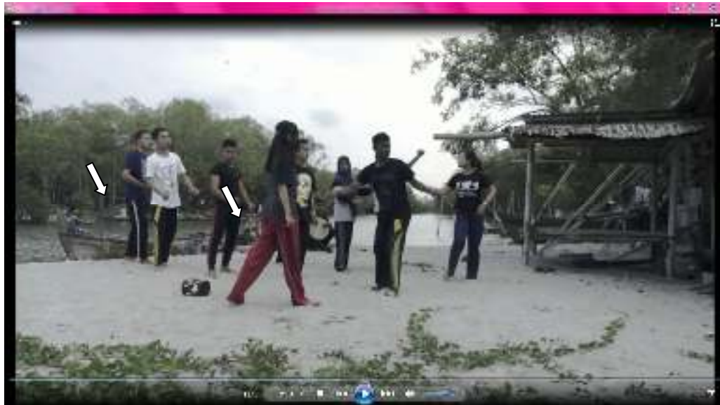
Gambar IV.11. Potongan gambar pada film lesTARI Pada menit (00.13.25-00. 15.10) (Sumber: Screenshot film lesTARI, 2019)

Scene ini jika di perhatikan dengan detail terdapat kebocoran didalamnya bukan dari audio melainkan berasal dari gambar, seperti tanda panah di atas. Anak-anak melihat dari balik sampan dan sesekali mereka melihat kamera. Perlu di sterilisasi kondisi tempat dari orang-orang sekitar yang menonton, untuk menghindari kebocoran-kebocoran yang bisa mengurangi estetika pada film.