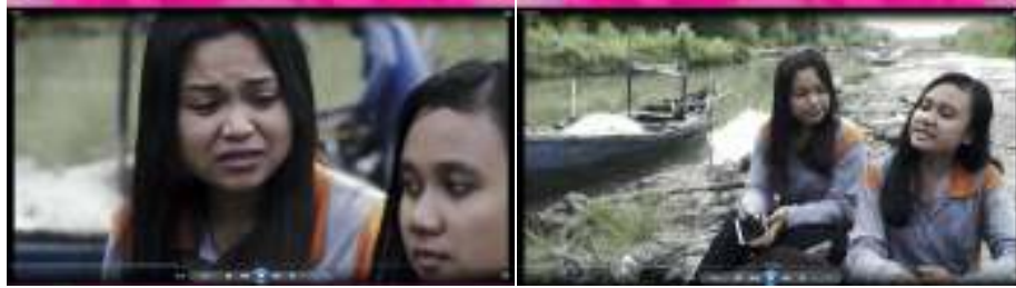
Gambar IV.10. Potongan gambar pada film lesTARI Pada menit (00.08.28-00.11.07)

Scene yang dimana menggambarkan Tari duduk besebelahan dengan Isma terlihat tidak continuity karena pada sudut pandang close up terdapat ada nelayan yang berada disamping ketika berpindah gerakan kamera menjadi medium shot nelayan sebelumnya tidak terlihat. Sehingga sangat terlihat sekali kurang diperhatikannya continuity dalam sudut pengambilan gambar.