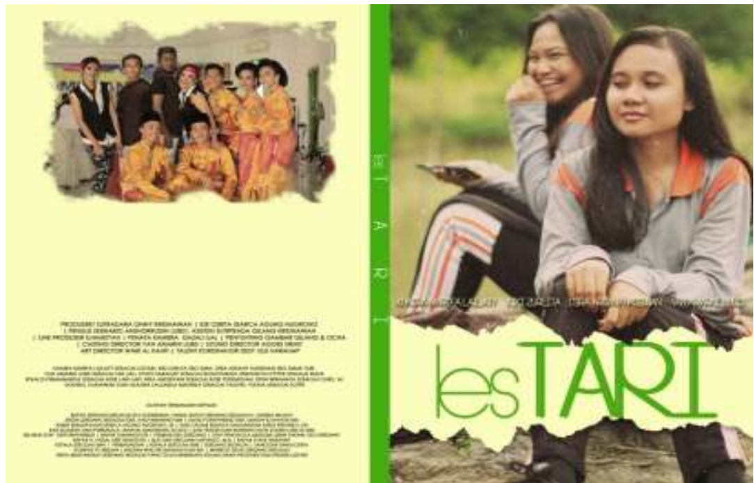
Gambar IV. 1. Poster film lesTARI

Pada film lesTARI terdapat sebuah cover yang mempunyai karakteristik yang dapat membedah sebuah sinopsis yaitu terdapat grub tari yang memakai pakaian adat yang mengartikan sebuah kebudayaan yang dilestarikan dan 2 orang anak perempuan yang dapat diartikan sebagai pemeran utama yang mempunyai tujuan yang sama. Adapun Cover film lesTARI dapat di lihat dibawah ini :