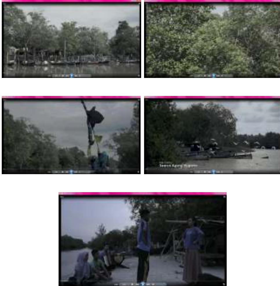
Gambar IV.3. Potongan gambar pada film lesTARI Pada menit (00.00.33-00.0 1.36)

Film “lesTARI” pada tahap permulaan ini diperlihatkan dengan adegan karakter Tari yang sedang mengajarkan teman-temannya menari di pesisir pantai. Fungsi adegan pembuka atau permulaan adalah untuk memperkenalkan setting (ruang dan waktu), tokoh, dan masalah utamanya kepada pennton. Adegan pembuka atau opening harus ditampilkan secara sistematis dan berstruktur agar penonton dapat mengenali satu-persatu dari mulai tokohnya, peristiwa