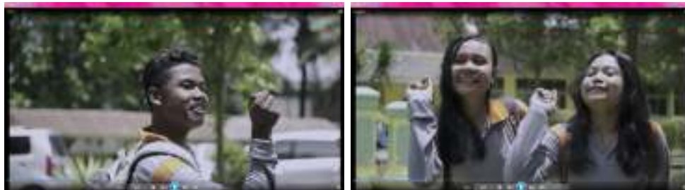
Gambar IV.6. Potongan gambar pada film lesTARI Pada menit (00.05.40-00.06.52) (Sumber: Screenshot film lesTARI, 2019)

Secene ini memiliki tiga karakteristik yang berbeda-beda, yang pertama si pemeran utama yaitu Tari, kedua teman perempuannya yang bernama Isma, dan yang terakhir seorang pria. Pemeran utama yaitu Tari memiliki karakter yang rendah hati dan juga peduli dengan budaya Melayu, sedangkan karakter Isma memiliki watak yang keras dan mudah terpengaruh pada budaya-budaya dari luar sehingga membuatnya terjerumus pada pergaulan bebas, dan pria yang ada pada gambar tersebut memiliki sifat kemayu dan suka berbicara hal-hal yang belum jelas kebenarannya. Ketiga karakter ini sangat bagus karena dapat membangkitkan gairah penonton dengan candaan tingkah laku konyol yang di perankan oleh si pria.