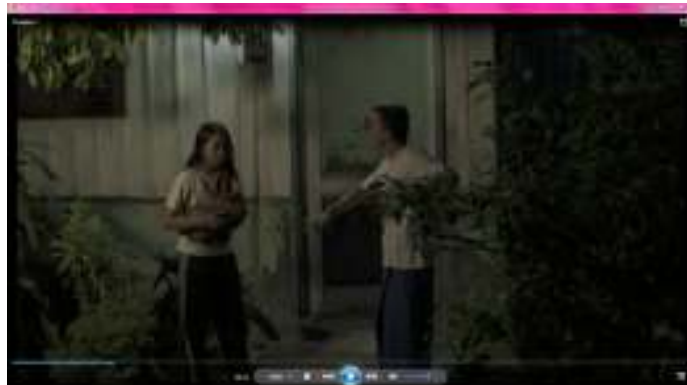
Gambar IV.6. Potongan gambar pada film lesTARI Pada menit (00.00.46-00.04. 10)

Setting tempat pada dua gambar ini menunjukkan kurang memperhatikan estetika dalam tata artistiknya. Seperti ada kain gorden dan helm yang sangat merusak tampilan film. Terlihat sekali tidak melakukan setting ulang .