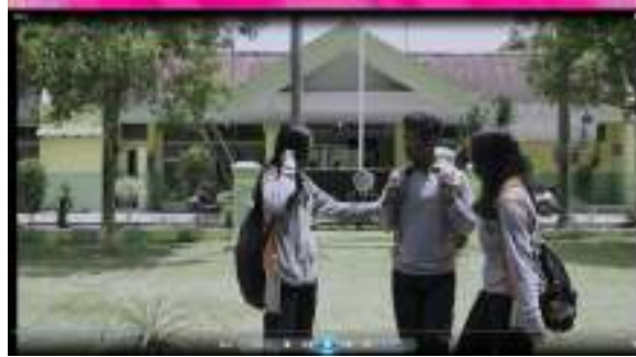
Gambar IV.7. Potongan gambar pada film lesTARI Pada menit (00.05.40-00.06.52) (Sumber: Screenshot film lesTARI, 2019)

Secene ini memiliki tiga karakteristik yang berbeda-beda, yang pertama si pemeran utama yaitu Tari, kedua teman perempuannya yang bernama Isma, dan yang terakhir seorang pria. Pemeran utama yaitu Tari memiliki karakter yang rendah hati dan juga peduli dengan budaya Melayu, sedangkan karakter Isma memiliki watak yang keras dan mudah terpengaruh pada budaya-budaya dari luar sehingga membuatnya terjerumus pada pergaulan bebas, dan pria yang ada pada gambar tersebut memiliki sifat kemayu dan suka berbicara hal-hal yang belum jelas kebenarannya. Ketiga karakter ini sangat bagus karena dapat membangkitkan gairah penonton dengan candaan tingkah laku konyol yang di perankan oleh si pria.