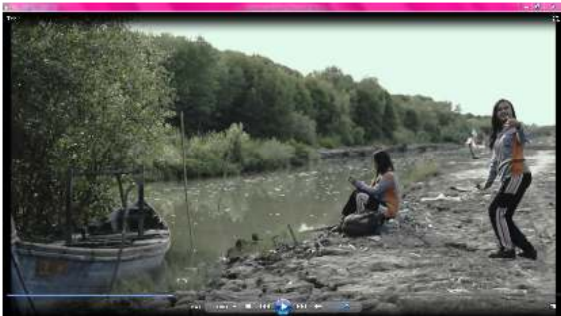
Gambar IV.8. Potongan gambar pada film lesTARI Pada menit (00.08.28-00.11.07)

Setting lokasi pada scene ini terlihat dua orang objek yaitu Tari dan Isma, Tari yang sedang menari di pinggir psisir pantai dengan penuh penghayatan, sedangkan Isma sedang duduk santai sambil bermain hp sangat terlihat dua orang wanita ini memiliki sifat yang berbeda, terlihat dampak bagaimana pengaruh budaya luar itu membuat Isma menjadi terpengaruh kedalam hal yang negatif.