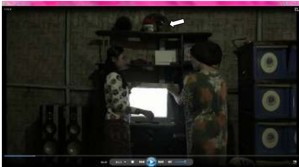
Gambar IV.5. Potongan gambar pada film lesTARI Pada menit (00.00.46-00.04. 10)

Setting tempat pada dua gambar ini menunjukkan kurang memperhatikan estetika dalam tata artistiknya. Seperti ada kain gorden dan helm yang sangat merusak tampilan film. Terlihat sekali tidak melakukan setting ulang .