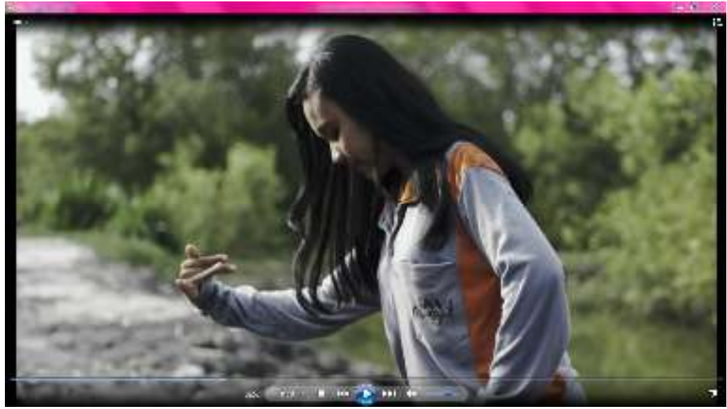
Gambar IV.9. Potongan gambar pada film lesTARI Pada menit (00.08.28-00.11.07) (Sumber: Screenshot film lesTARI, 2019)

sangat berpengaruh bagi para penonton atau penikmat film untuk membangun mood penonton dengan pemilihan latar yang tepat.