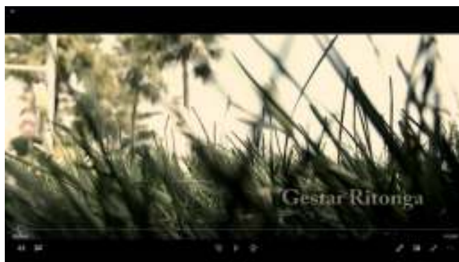
Gambar IV.3. Split gambar untuk Intro

Logo Oneto Films dalam bumper film menggunakan warna putih sebagai warna awal film di mulai dimanawarna putih sering dikait-kaitkan dengan arti terang, kebaikan, kemurnian, keperawanan, dan kesucian sehingga tidak jarang warna putih sendiriselalu disimpulkan dengan warna kesempurnaan. Penambahan split gambar yang diambil dengan bertemakan kostum putih untuk laki-laki dan perempuan juga memberikan arti kesucian cinta. Dimana teknik pengambilan split gambar menggunakan beberapa pengambilan yaitu eye level dan low angle untuk memberikan kesan yang mengancam dan berkuasa dengan menggunakan teknik medium shot dan medium long shot untuk menunjukkan bahasa tubuh dari pemeran utama kepenontonnya.