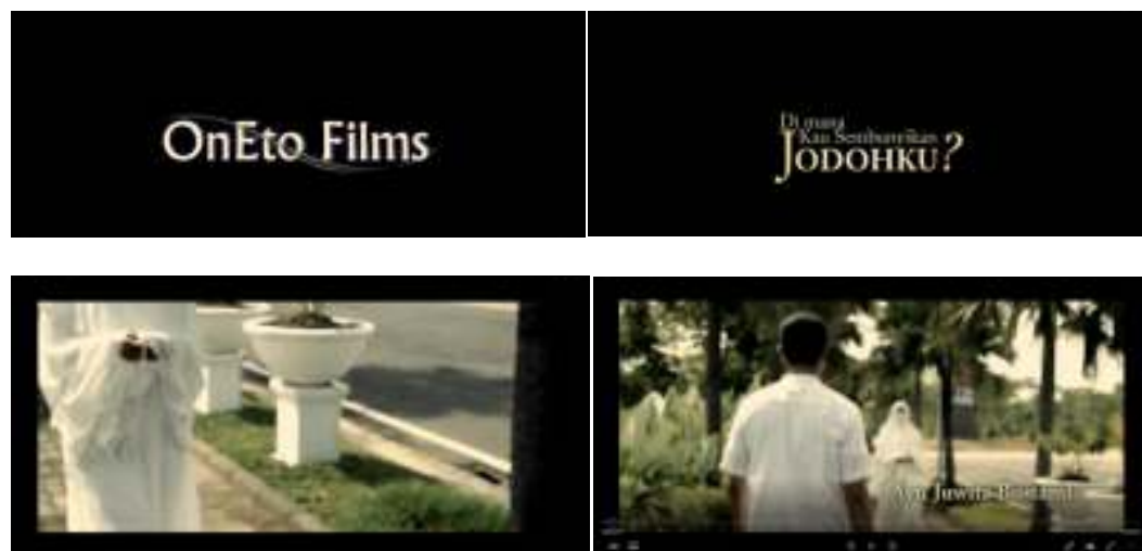
Gambar IV.2. Intro film Dimana Kau Sembunyikan Jodohku

Intro yang digunakan pada film Dimana Kau Sembunyikan Jodohku meliputi bumper rumah produksi dan beberapa penggalan scene maupun efek. Adapun bentuk bumper dan beberapa scene pada film Dimana Kau Sembunyikan Jodohku .