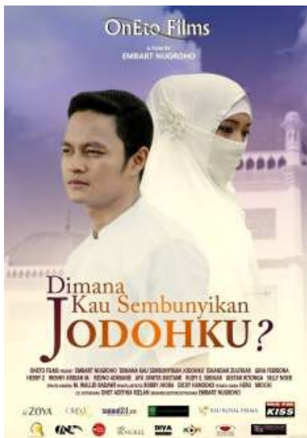
Gambar IV.1. Poster Film Dimana Kau Sembunyikan Jodohku

Tayangan-tayangan film indie lokal yang sering bersaing pada saat ini biasanya meliputi film yang dapat menggaet penonton tekhususnya sebuah filmyang mampu memasuki tarap bioskop-bioskop daerah seperti CGV. Seperti halnya film Dimana Kau Sembunyikan Jodohku Sutradara Embart Nugroho. Kelebihan yang menjadi daya tarik tersendiri dalam film ini adalah dalam setiap adegan yang di perankan oleh Fatimah memiliki pesan moral yang dapat dipetik dari penonton. Sesuai dengan gendre film yang di bawakan oleh Oneto Films menyangkut drama religi yang dibumbuhi dengan romance-romance percintaan sehari-hari dalam masyarakat.