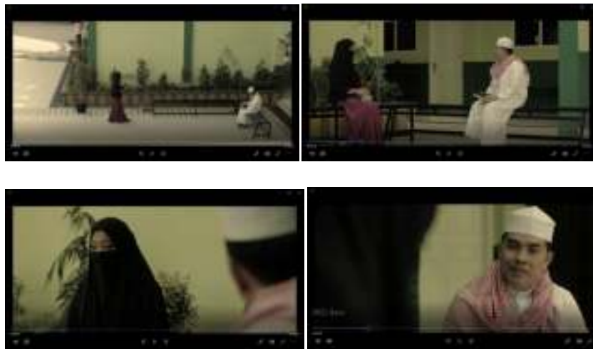
Gambar IV.6. adegan Halaman Pesantren

Deskripsi dari Gambar IV.6. adegan Halaman Pesantren menceritakan dimana dialog yang terjadi antara Ust. Hamid dan Fatimah yang menceritakan keresahan dan kegunda gulanaan hati Fatimah karena bisa meminipikan seorang laki-laki yang tidak di kenal dengan Fatimah sehingga Fatimah menceritakan keresahan hatinya kepada Ust. Hamid selaku sebagai pendidik pesantren karena menurut Fatimah memimpikan seorang laki-laki yang tidak di kenal merupakan aib yang buruk untuk dirinya. Tetapi alangkah terkejutnya Fatimah setela Fatimah menceritakan semua tentang mimpinya Ust. Hamid menyampaikan bahwa mimpi itu bunganya tidur dan bisa menjadi suatu pertanda bahwa jodoh sudah dekat.