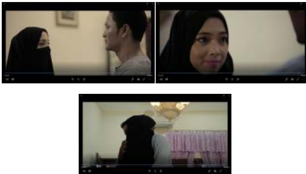
Gambar IV.11. Adegan Ruang Tamu Rumah Zidan

Deskripsi adegan dari Gambar IV.11. Adegan Ruang Tamu Rumah Zidan menceritakan dimana kondisi terpuruk Zidan yang mendapatkan penolakan dari istrinya. Namun, ditengah lamunan Zidan mendengar suara lembut dari wanita yang sedang Zidan pikirkan. Dan dengan terkejutnya ternyata suara yang disimpulkan oleh Zidan bukan hanya sekedar mirip ternyata memang benar itu suara istrinya Fatimah. Dalam adegan tersebut juga terdapat penjelasan Fatimah dan menunjukkan wajah yang selama ini diragukan oleh Zidan. Setelah Zidan mengetahui semuanya Zidan merasa bersalah dan berjanji tidak akan menyakiti istrinya lagi.