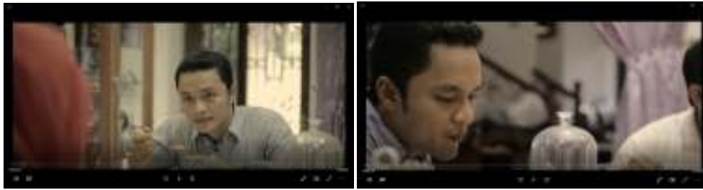
Gambar IV.5. adegan Ruang Makan

Deskripsi dari penggalan adegan pada Gambar IV.5. adegan Ruang Makan menggambarkan suasana pagi hari antara keluarga di meja makan. Di dalam adegan tersebut juga merupakan konflik awal dalam keluarga, di mana Zidan dengan keegoisannya dan Orang tua dengan pendiriannya. Secara garis besar memiliki struktur ataupun komposisi film sebagai berikut. Zidan turun dari tangga menuju rak sepatu sambil sesekali melirik orang tuanya yang sedang bercengkrama, sebelum Zidan selesai menggunakan sepatu mama Zidan sudah lebih dulu menyuarakan pendapat untuk Zidan ikut bergabung ke meja makan untuk sarapan pagi berguna membicarakan keseriusan antara Zidan untuk masa depannya.