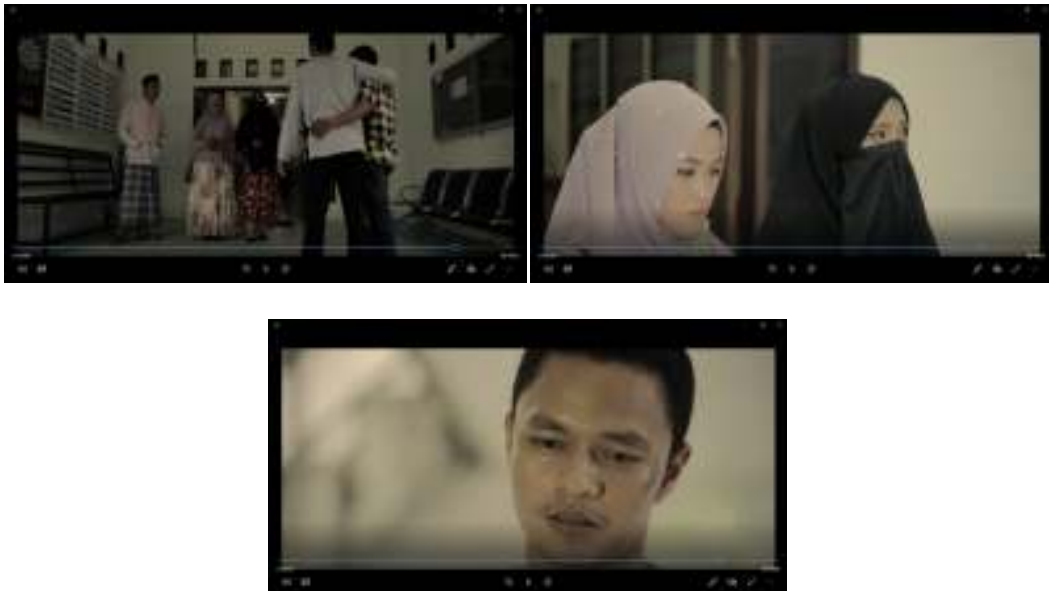
Gambar IV.10. adegan Depan Gerbang Pesantren