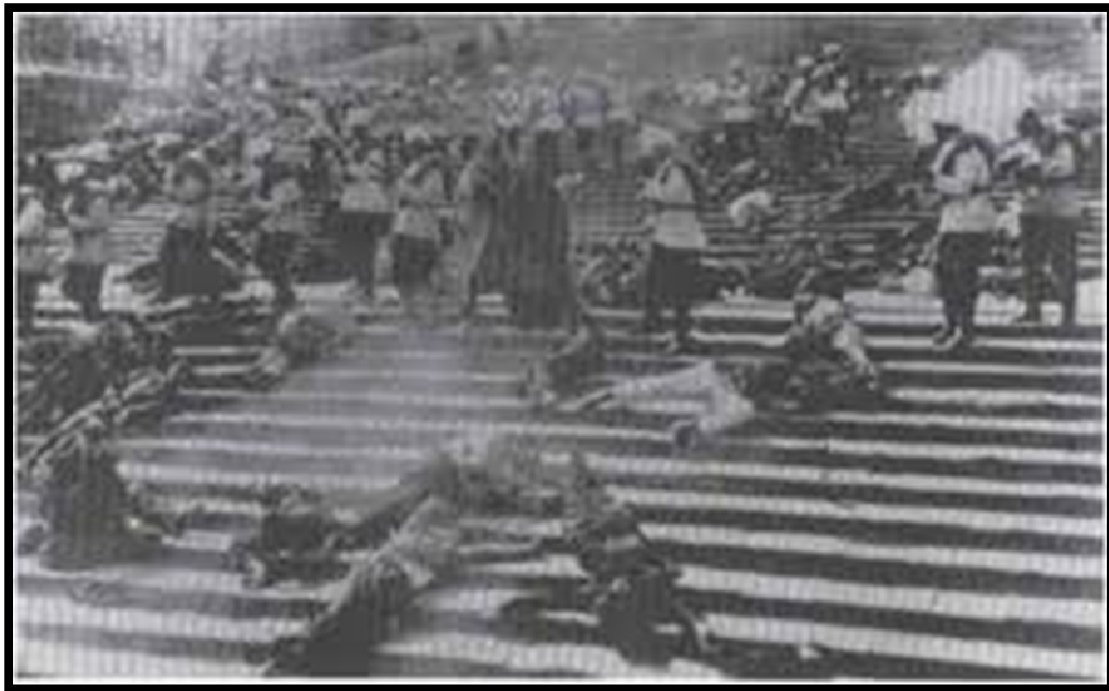
Gambar III.6. Film Battleship Potemkin (1925) Long Shot

Overtonal Montage adalah interaksi dari metrik , rhythmic , dan tonal montage . Interaksi yang mencampur kecepatan, ide, dan emosi untuk menginduksi efek yang diinginkan dari para penonton. Overtonal montage secara organik adalah perkembangan terjauh di sepanjang garis montase tonal. Karakteristik ini meningkatkan kesan dari pewarnaan emosional melodi ke persepsi fisiologis langsung. Ini juga mewakili tingkat yang terkait dengan level sebelumnya. Adapun pada gambar dibawah ini menekankan penyalahgunaan kekuasaan para tentara dan eksploitasi ketidakberdayaan warga.