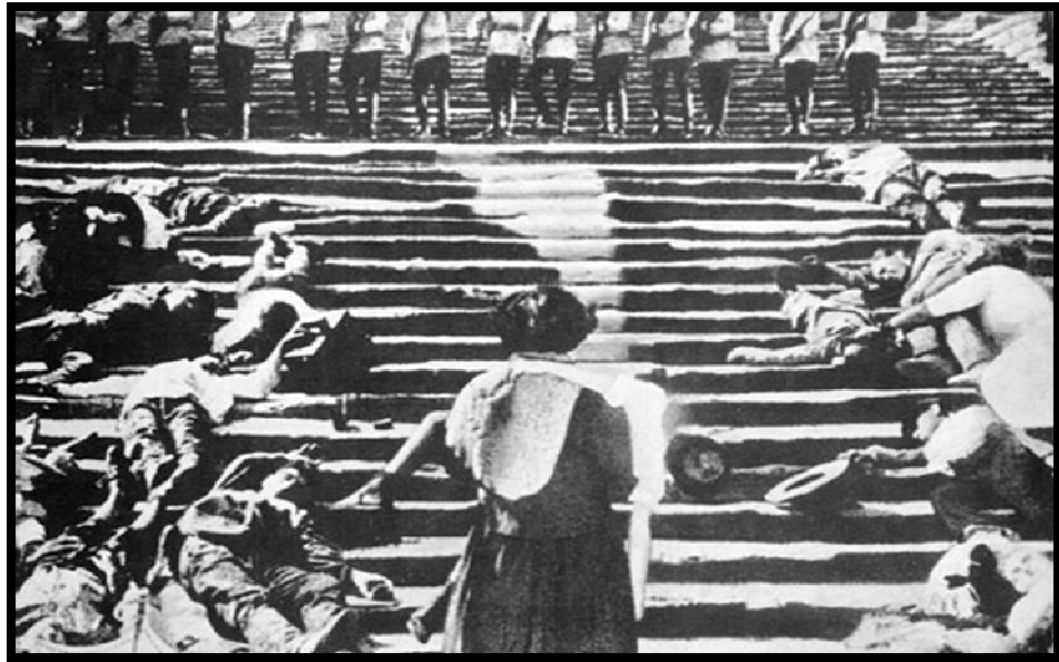
Gambar III.4. Film Battleship Potemkin tentara berbaris (1925) Long Shot