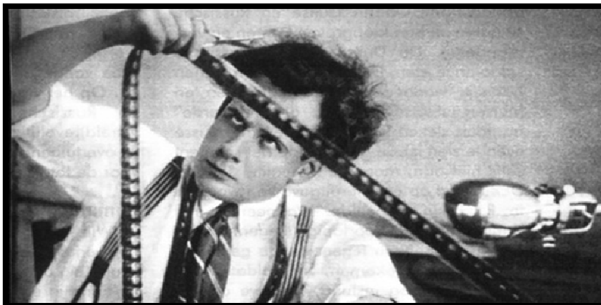
Gambar III.1. Sergei Eisenstein

Sergei Eisenstein memiliki nama asli Sergei Mikhailovich Eizenshtein. Eisenstein adalah kunci kedua sebagai sineas dalam perfilman Rusia. Sebagai sutradara, dia mungkin yang terbaik. Eisenstein banyak menulis tentang ide-ide film dan akhirnya mengajar untuk membangun generasi sutradara di Rusia. Eisenstein lahir di Riga, Latvia, Rusia ini sebenarnya seorang arsitektur. Dia belajar arsitektur dan teknik di Petrograd Institute of Civil Engineering. Eisenstein mengenal dunia perfilman secara tidak sengaja ketika pada tahun 1920 Eisenstein melihat pertunjukan teater Kabuki dan tertarik belajar bahasa Jepang. Eisenstein kemudian pindah ke Moskow dan memulai karirnya dalam dunia teater dengan bekerja di Proletkult. Sergei Eisenstein dikenal sebagai “Bapak Montase Dunia” . Adapun gambar di bawah ini merupakan gambar Sergei Eisenstein.