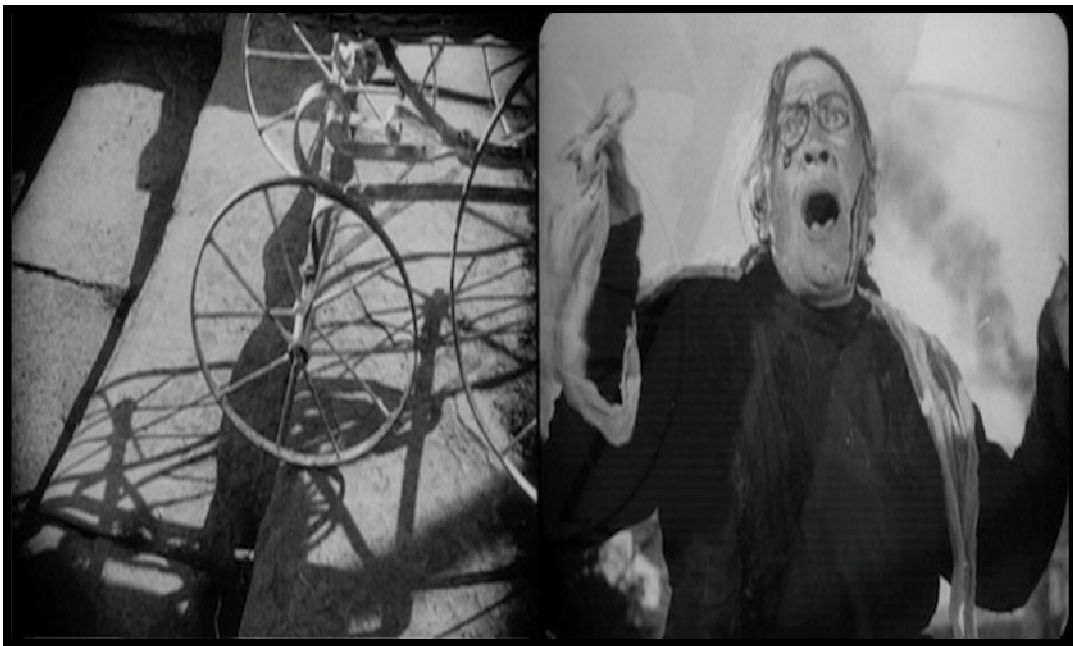
Gambar III.7. Film Battleship Potekim (1925) kreta bayi di tangga

Intellectual Montage mengacu pada pengenalan ide menjadi urutan yang sangat dituntut dan emosional. Intelektual montase adalah bukan montase suara overtonal fisiologis secara umum, tetapi suara dan nada suara intelektual: yaitu, konflik-penjajaran efek intelektual yang menyertainya. Intelektual montase mengacu pada pengenalan ide ke dalam urutan yang sangat bermuatan dan emosi. Adapun contoh gambar di bawah ini yang dapat memberikan suara dan nada intelektual, suara atau nada yang dihasilkan dari kreta sorong bayi yang tergelincir di tangga dan membangun ekspresi emosional seserang.