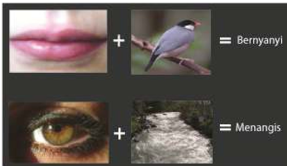
Gambar III.2. Montage pemikiran Sergei Eisenstein

Eisenstein melihat tabrakan sel satu tembakan atau sel montase dengan yang lain sebagai menciptakan konflik yang menghasilkan ide baru. Ide baru ini akan menjadi tesisnya sendiri dan berbenturan dengan anti-tesis lainnya yang