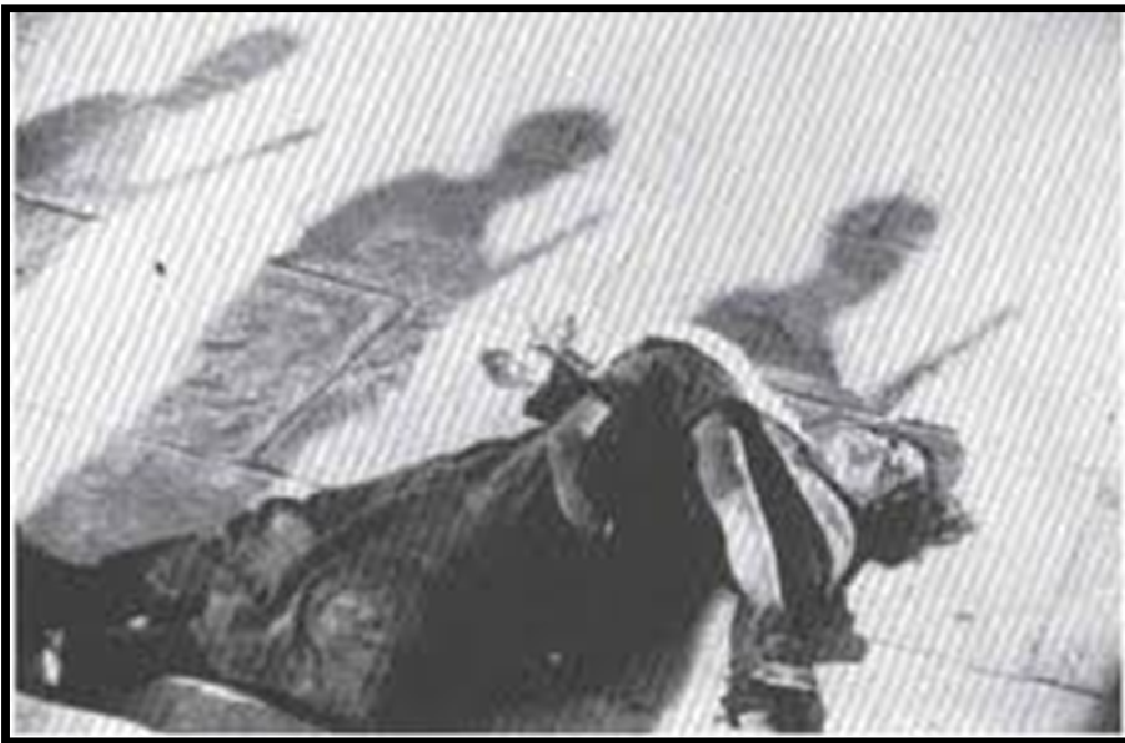
Gambar III.5. Film Battleship Potemkin (1925) High Angle

Gerakan-gerakan seperti itu di dalam bingkai mungkin berupa objek yang bergerak, atau dari mata penonton yang diarahkan sepanjang garis dari beberapa objek bergerak. Dalam montase tonal, gerakan dirasakan dalam arti yang lebih luas. Konsep gerakan mencakup semua pengaruh potongan montage . Adapun pada gambar di bawah ini menceritakan tentang kematian ibu muda di tangga dan urutan kreta bayi berikut menyoroti kedalaman tragedi pembantaian