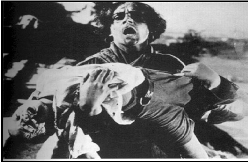
Gambar III.3. Film Battleship Potemkin (1925) Medium Shot