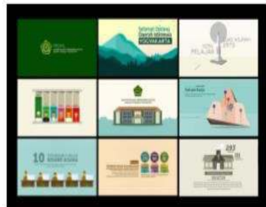
Gambar II.7. Hasil Motion Graphic

Dalam karya yang di buat oleh Fajar Nugroho, Mei P. Kurniawan disini dia membuat animasi motion graphic profil dengan menyertakan aset keagamaan yang dimiliki Daerah Istimewa Yogyakarta dengan gaya visual flat design minimalis. Yang berupa slide sesuai dengan urutan di buku profil yang dimiliki instansi dengan menggabungkan informasi dari buku data keagamaan.