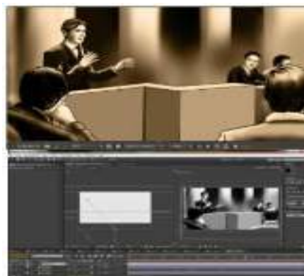
Gambar II.6. Hasil Motion Graphic

Chendy Jeane Beatrik menyampaikan biografi singkat Dr. Gerungan Saul Samuel Jacob Ratulangi ini, dengan cara penyampaian melalui video Motion Graphic. Warna yang akan digunakan chendy Jeane Beatrik dalam penggambaran biografi ini, adalah warna sephia. chendy Jeane Beatrik ingin membuat shot dimana gambar 2d yang dibuat akan terlihat seperti 3d dikarenakan adanya susunan layer yang akan membuat visual terlihat seperti 3d.