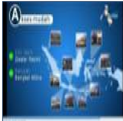
Gambar II.5. Hasil Motion Graphic