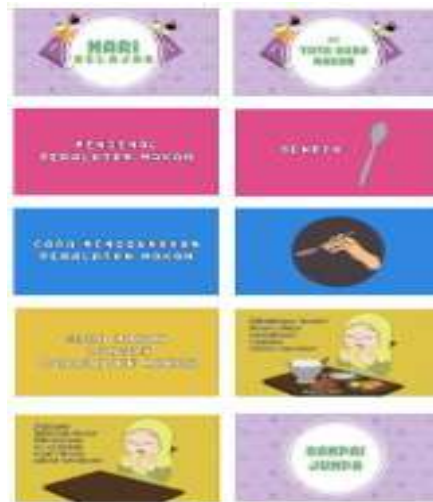
Gambar II.4. Hasil Motion Graphic