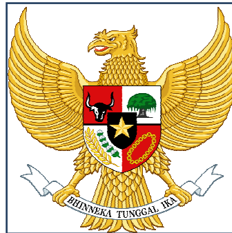
Gambar .II.1: Burung Garuda Pancasila sebagai simbol Negara ( http://agusramdanirekap.blogspot.com/2011/12/arti-dan-makna-lambang-garudapancasila.html )

Tahukah Anda apa arti dari simbol yang termuat dalam perisai di dada Burung Garuda tersebut? Berikut adalah arti dalam lambang Garuda Pancasila tersebut: