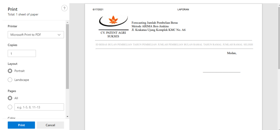
Gambar IV.7. Tampilan Form Laporan Peramalan

Tampilan yang disajikan oleh sistem untuk menampilkan Form Peramalan dapat dilihat pada gambar IV.7.