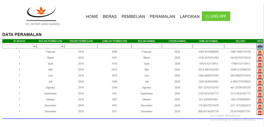
Gambar IV.6. Tampilan Form Peramalan

Tampilan yang disajikan oleh sistem untuk menampilkan Form Peramalan dapat dilihat pada gambar IV.6.