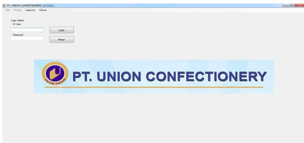
Gambar IV.1. Tampilan Form Login

Tampilan Login merupakan tampilan yang pertama kali muncul ketika program dijalankan. Berfungsi sebagai form input username dan password admin program. Gambar tampilan login dapat ditunjukkan pada gambar IV.1 :