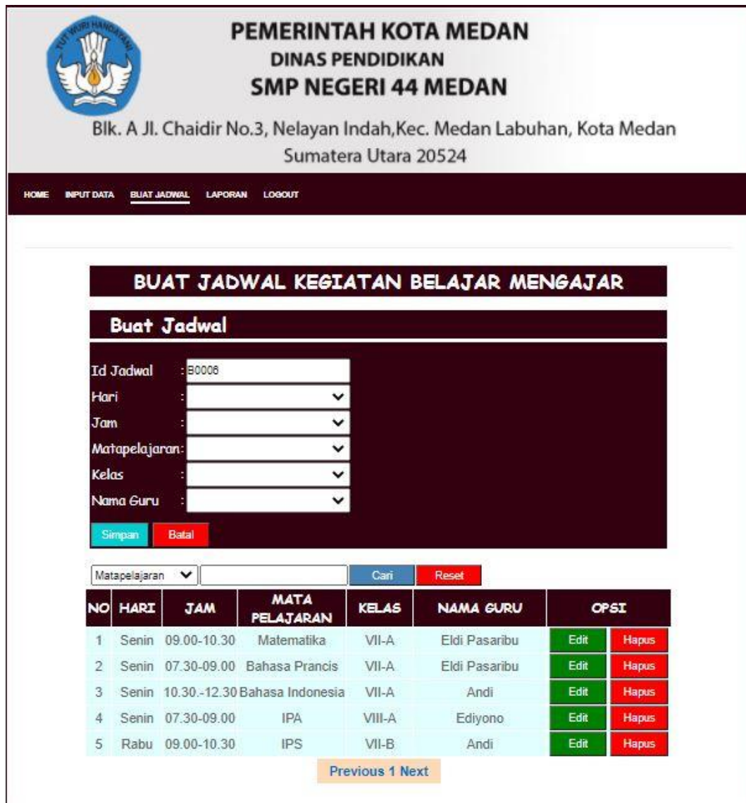
Gambar IV.5. Halaman Buat Jadwal KBM