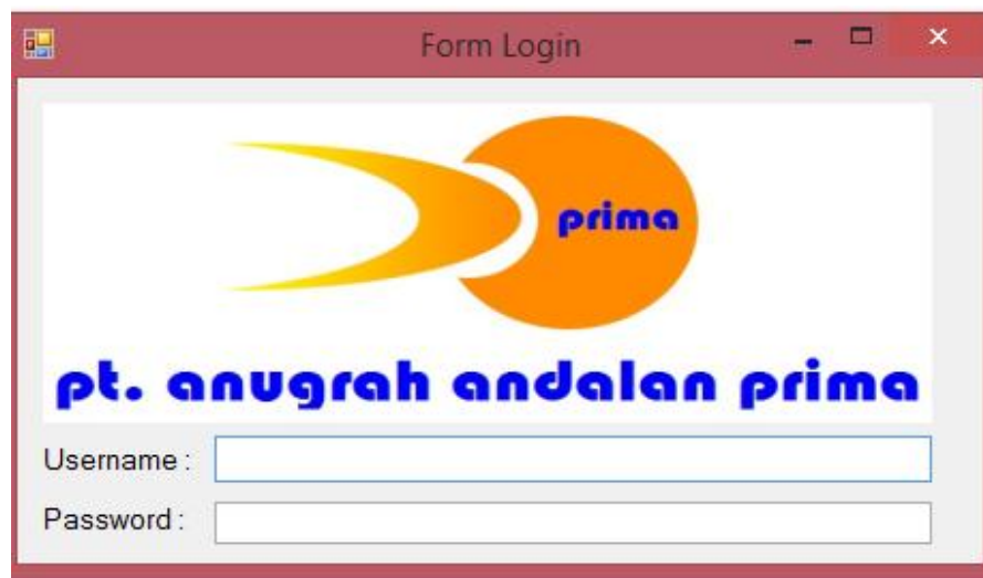
Gambar IV.1. Tampilan Form Login

Tampilan yang disajikan oleh sistem untuk melakukan login admin dapat terlihat seperti pada gambar IV.1 berikut :