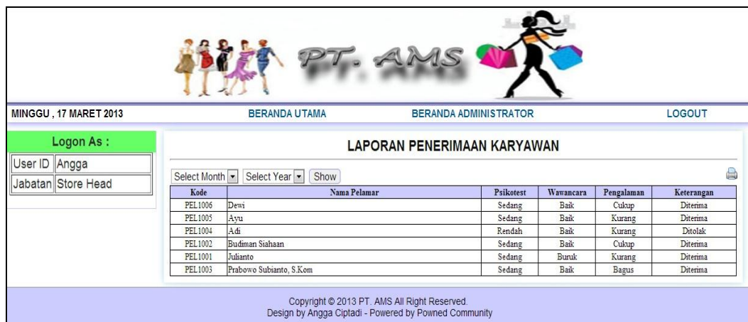
Gambar IV.15: Form Menu Laporan

Form ini berfungsi untuk menampilkan hasil kandidat nilai calon tenaga kerja yang memenuhi syarat ataupun tidak memenuhi, data tersebut sebelumnya sudah diproses melewati yang cara ditentukan. Pada menu laporan ini, data pelamar dapat dikelompokkan berdasarkan tanggal atau priode yang diinginkan. Terlihat seperti gambar IV.16.