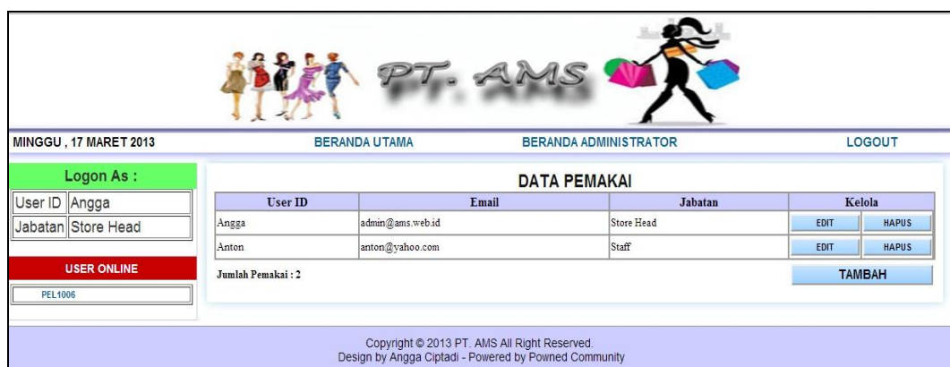
Gambar IV.6: Tampilan Form Data Pemakai

Form ini berfungsi untuk kelola user / kelola data pemakai, kelola user yang didalamnya berisikan userID , email , Jabatan .