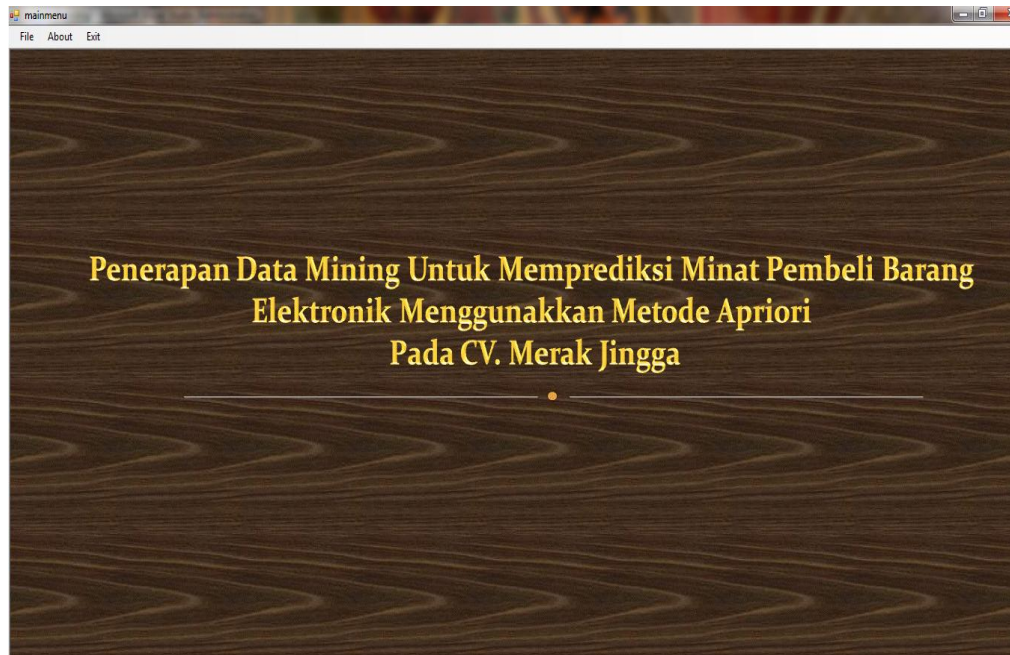
Gambar IV.1. Tampilan Form Menu Utama

Form ini berfungsi untuk menampilkan menu bagian utama, menu Data item set , data item dan proses apriori seperti terlihat pada gambar IV.1.