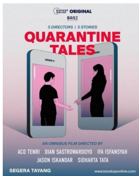
Gambar 1. Poster Film Quarrantine Tiles

datang dengan film berjudul Cook Book. Film ini menceritakan tentang seorang koki yang memilih mengisi waktu karantinyanya dengan menyelesaikan buku resep. Sementara itu, dalam film Happy Girls Don't Cry, Acho Tenri memilih mengangkat fenomena giveaway. Selanjutnya ada sutradara Jason Iskandar yang memotori film Prankster. Film ini terinspirasi dari para Youtuber yang ingin viral dengan cara kurang terpuji. Sementara, The Protocol yang merupakan buah karya sutradara Sidharta Tata, berkisah tentang perampok yang panik karena rekannya mendadak meninggal setelah batuk-batuk. Inspirasi utama penulis dalam menciptakan film pendek “Dari Hati” adalah dari film ini. Tema yang diangkat sesuai dengan keadaan saat ini. Beberapa visualnya juga menginspirasi yang kemudian penulis terapkan dalam penciptaan film pendek “Dari Hati” dengan menggunakan subjective camera angle . Pengambilan sudut pandang dari penonton akan menempatkan kamera pada banyak posisi sehingga penerapannya akan memudahkan penulis mengeksplorasi hal lain, tidak terbatas oleh beberapa angle saja.