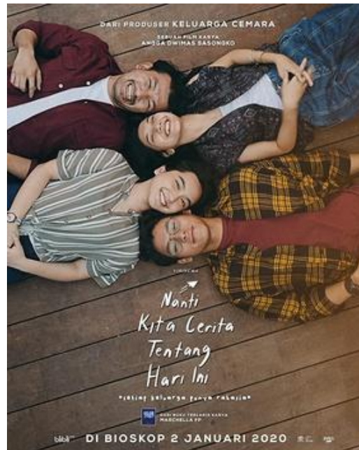
Gambar 2. Poster Film 7 Rahasia Sophie

Dalam sebuah penciptaan film, mood dan warna adalah hal penting yang harus dipersiapkan semua hal itu lalu berkaitan dengan teknik subjective camera angle yang dipakai. Warna dan mood yang telah ditentukan akan mempermudah penulis dalam menentukan pergerakan kamera, tempo, lensa serta pencahayaan.